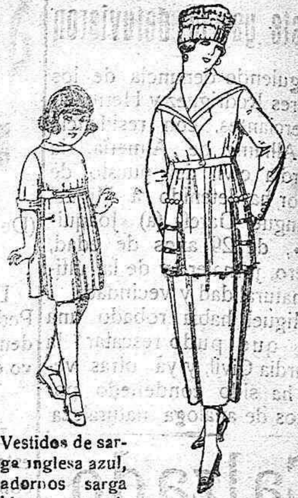
Vestidos de sarga inglesa azul, adornos sarga blanca, para niñas de 4 a 9 años. en negro, azul y color de pta. 36 a 40.