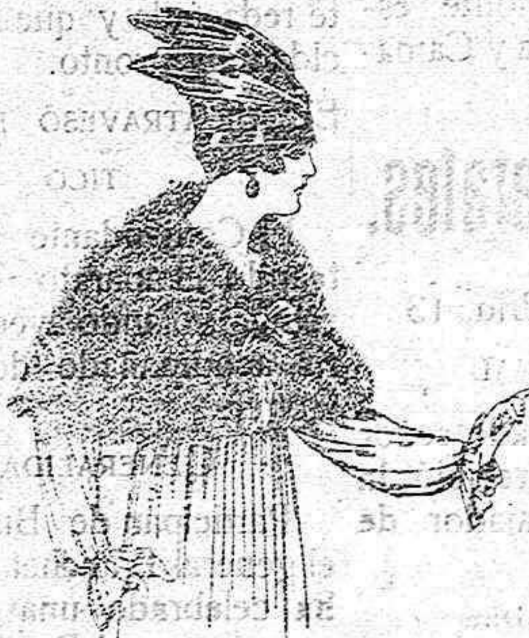
Capelinas de marabú adornadas, con cinta y forro de seda de ptas. 32 a 40