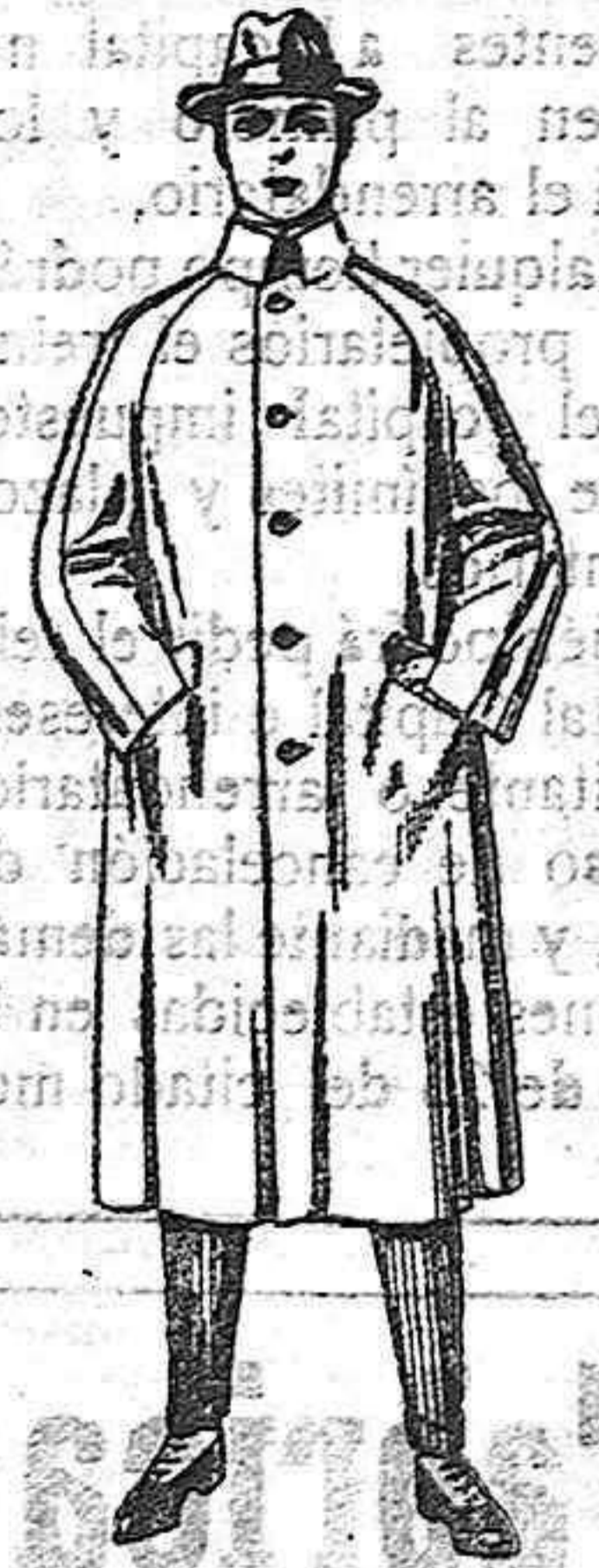
Gabanes de patén, chevi-cower. de ptas. 70 a 150