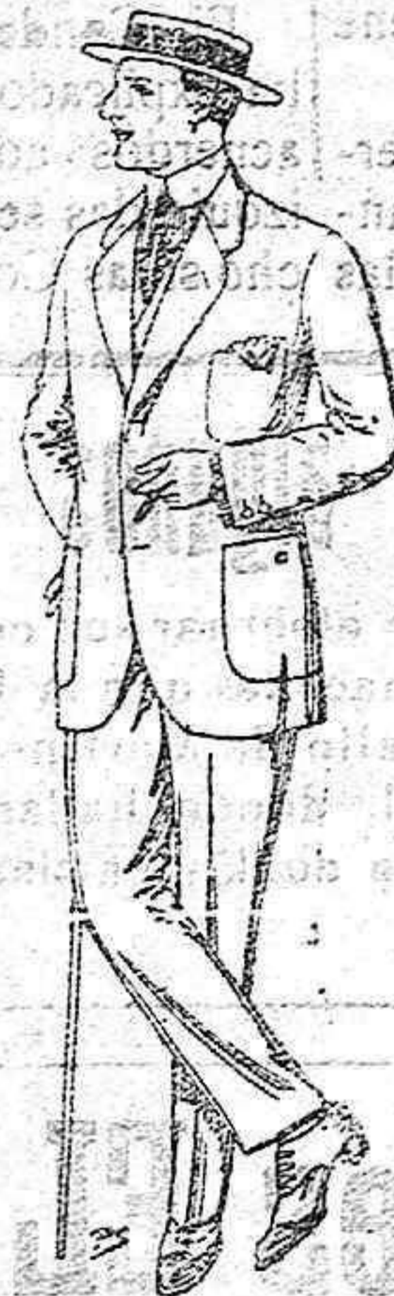
Trajes de dril crudo, kaki o listado. de ptas. 17 a 48. El mismo modelo en estambre «Fresco» de ptas. 40 a 80