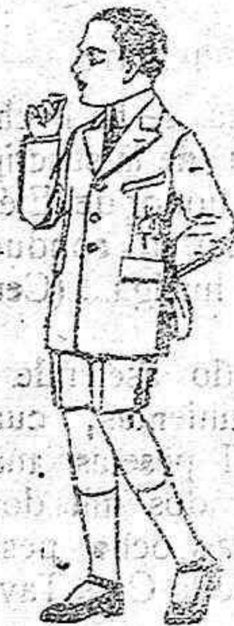
Trajes modelo Sport, de lanilla, estambre, melton, etc., para niños de 7 a 12 años de 28 a 30