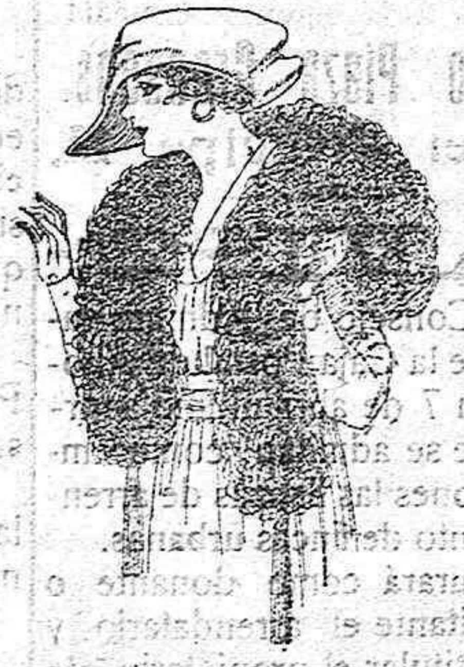
Boa de pluma de avestruz, en negro, blanco, café y gris, etc. de ptas. 32 a 70.