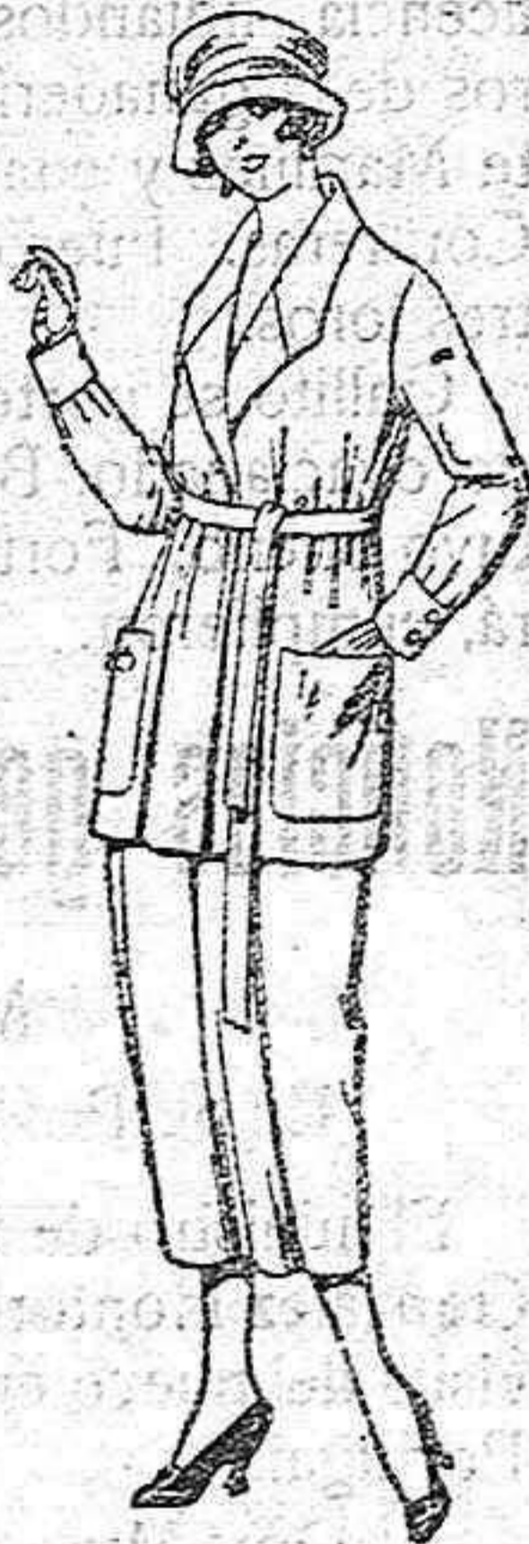
Trajes de gabardina, estambre, lanilla, etc., en negro, azul y color. de ptas. 103 a 115

Camisería, Géneros de punto, Guantería, Sombrerería, Corbatería, Zapatería, Paraguas, Bastones y Artículos de Viaje.