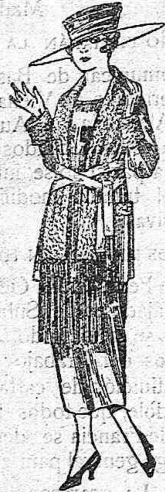
Paletos de punto de lana, cuello bufanda de ptas. 50 a 58.

SUCURSALES: Madrid, Barcelona, Alicante, Bilbao, Cádiz Cartagena, Gijón, Granada, Málaga, Palma de Mallorca, Santander, Sevilla, Valencia, Valladolid, Zaragoza.