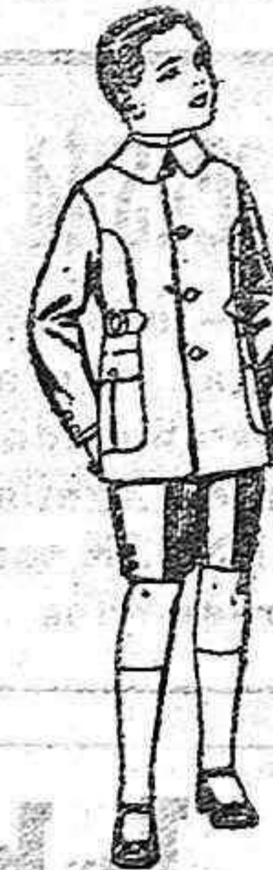
Trajes modelo Sport de lanilla, estambre, melton, etc. para niños de 4 a 9 años. de ptas. 25 a 48