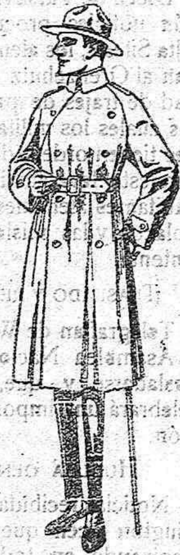
Gabanes impermeabilizados con cinturón «American trench coat» de ptas. 180 a 350