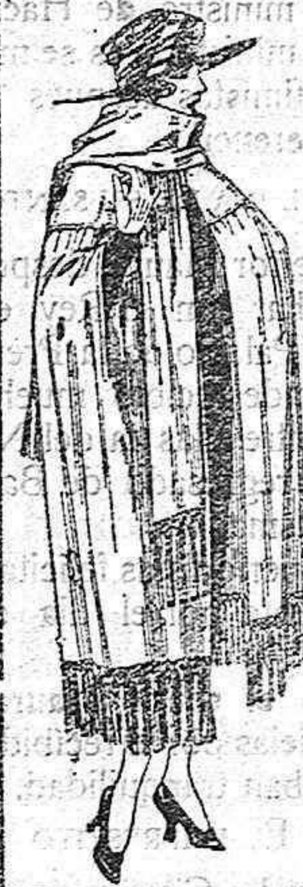
Capas de gabardina inglesa, diferentes colores. a ptas. 130

Ropas confeccionadas para Caballero, Señora, Niño y Niña