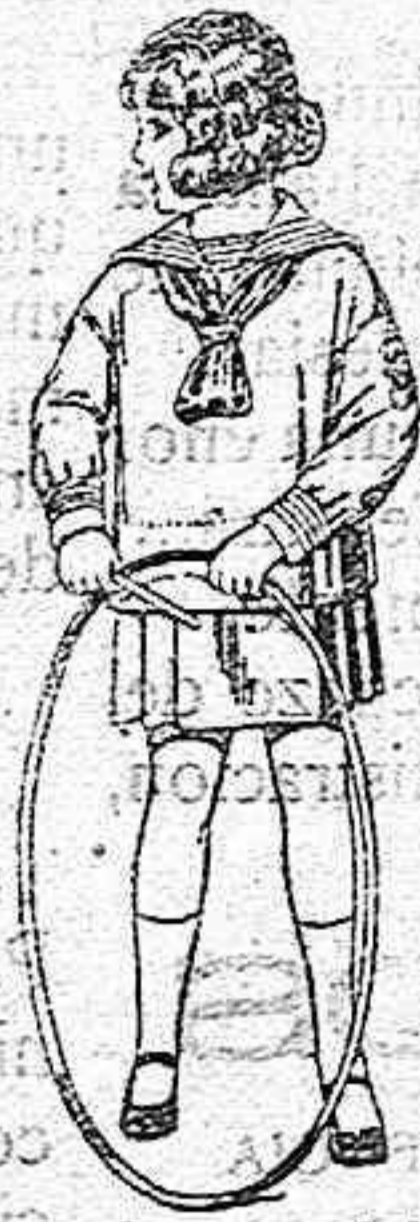
Trajes modelo Marinera inglesa de estambre o jerga azul para niños de 4 a 9 años de pta. 30 a 42