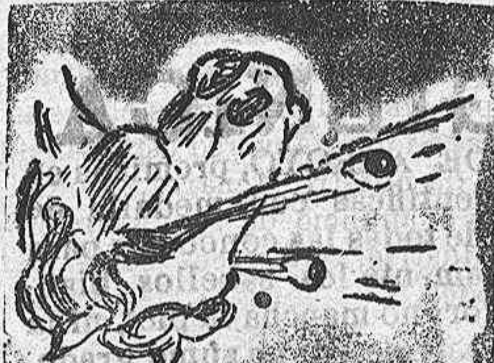
La solución mañana.