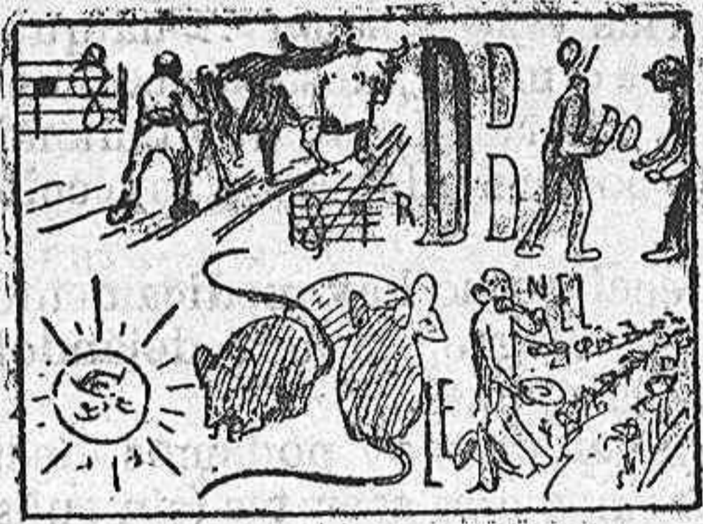
La solución mañana.