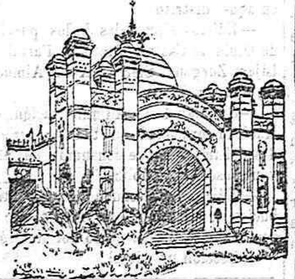
Portada principal del palacio de la Agricultura.