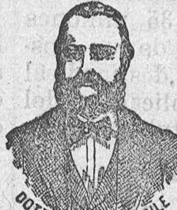
DR. NICOLA CASILE

han logrado que el Dr. Casile de Nápoles descubriera los milagrosos medicamentos que curan infaliblemente la tisis en cualquiera de sus periodos y todas las enfermedades del estómago. A la más pequeña manifestación de un resfriado, tos, catarro, bronquitis, gripe, asma (asofocación), expectoración y de cualquier enfermedad del pecho, tomar inmediatamente las PERLAS CASILE, que no solo curan infaliblemente estas enfermedades, sino que se tendrá la completa seguridad de no encontrar otras muchas más graves. Siguiendo este método se podrá decir no más tisis. Si por desgracia no se hubiera seguido este tratamiento y por desgracia cualquier persona se encontrara atacada de tisis, no tiene que apurarse porque gracias a los constantes estudios hemos podido encontrar los renombrados Confites Casile que asociados a las Perlas combaten con eficacia la tisis en cualquiera de sus periodos.