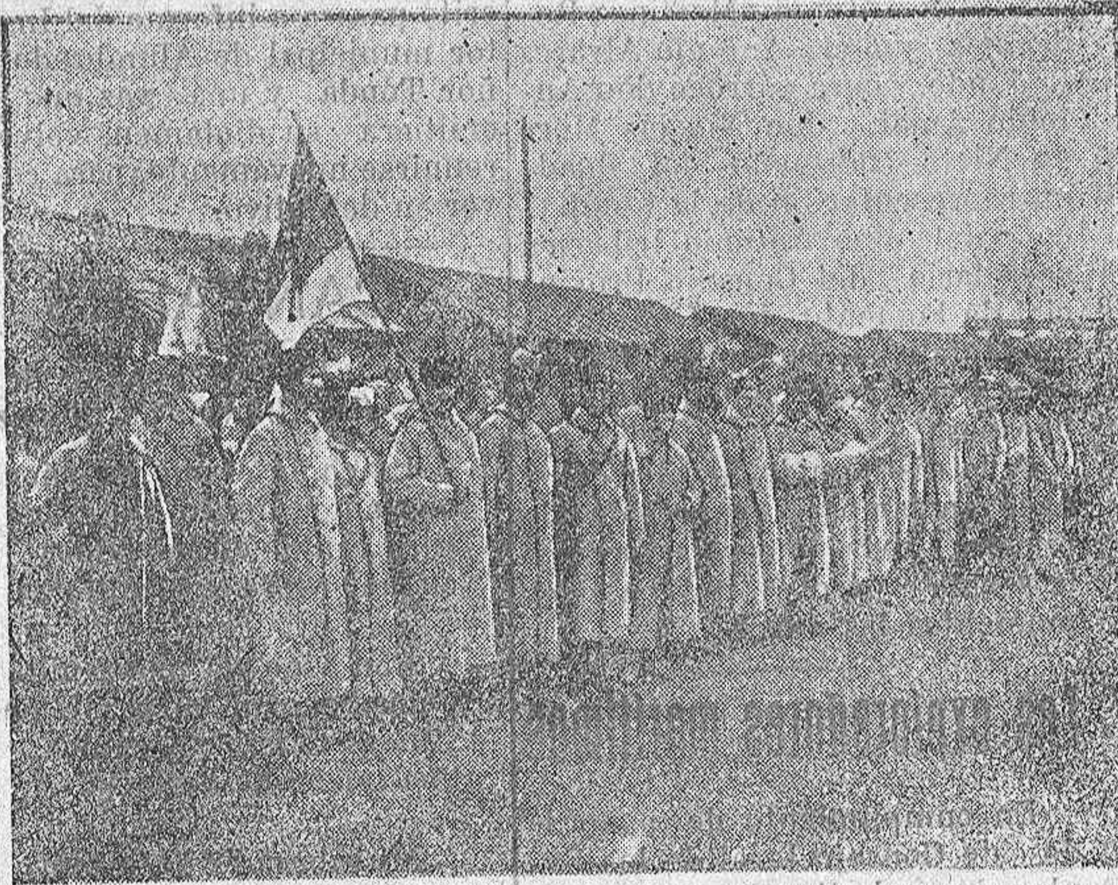
Fot. Información. Del ejército francés.—Guardia de bandera de un regimiento colonial.