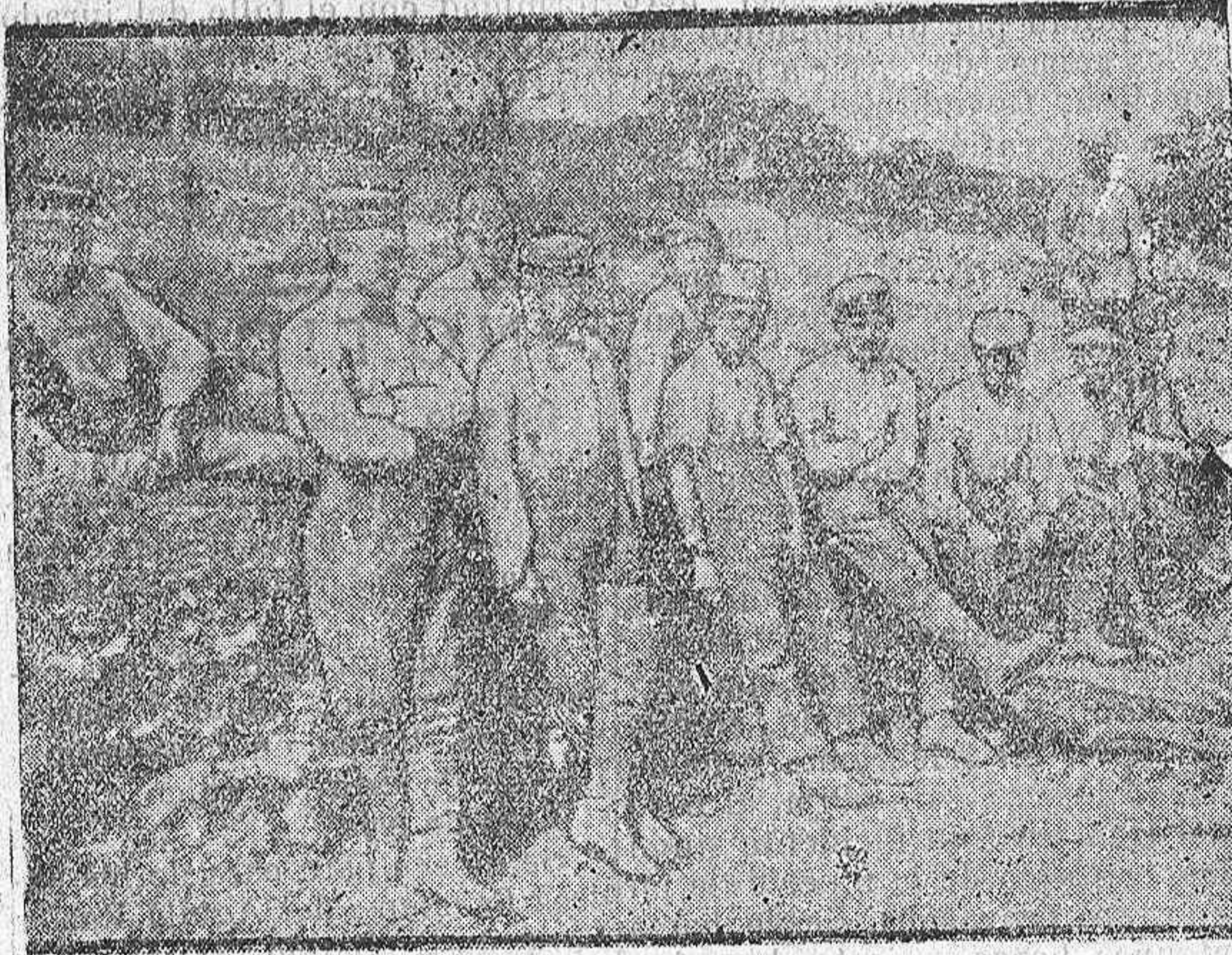
Fot. Información En Francia. Prisioneros alemanes destinados a las faenas agrícolas.

la doctrina de Monroe, y hasta que punto la respetaría si la victoria le permitiera violarla."