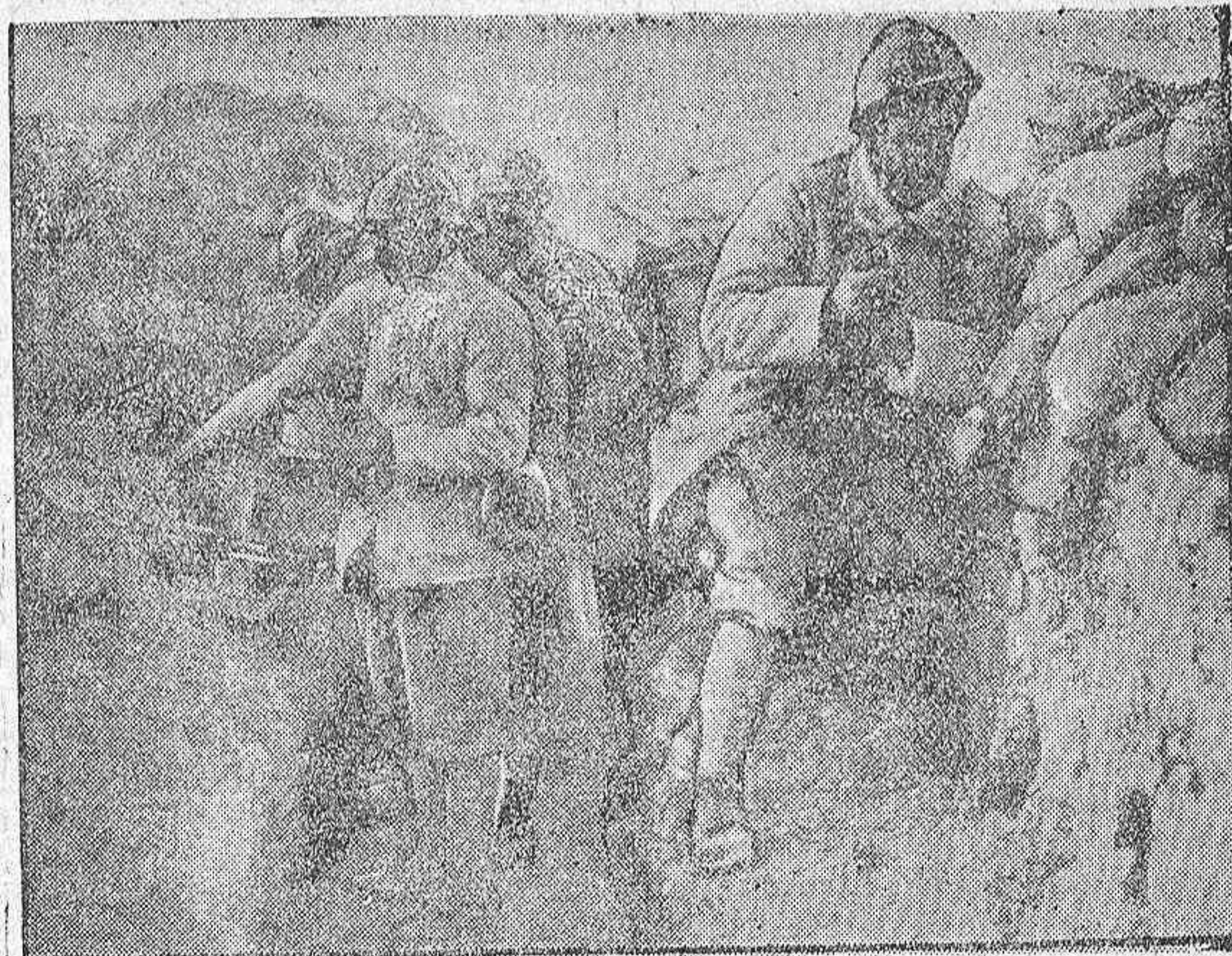
En el frente francés.— La comida en un puesto avanzado