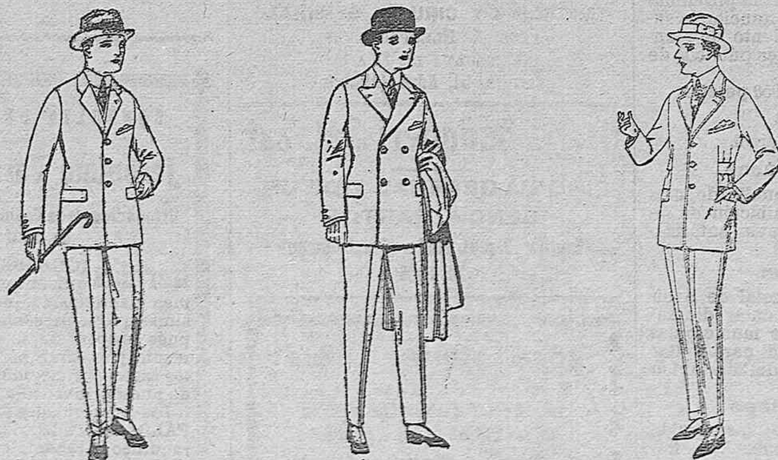
Trajes de patén, vicuña o jerga, para niños y jovencitos de 10 a 16 años de ptas. 30 a 85