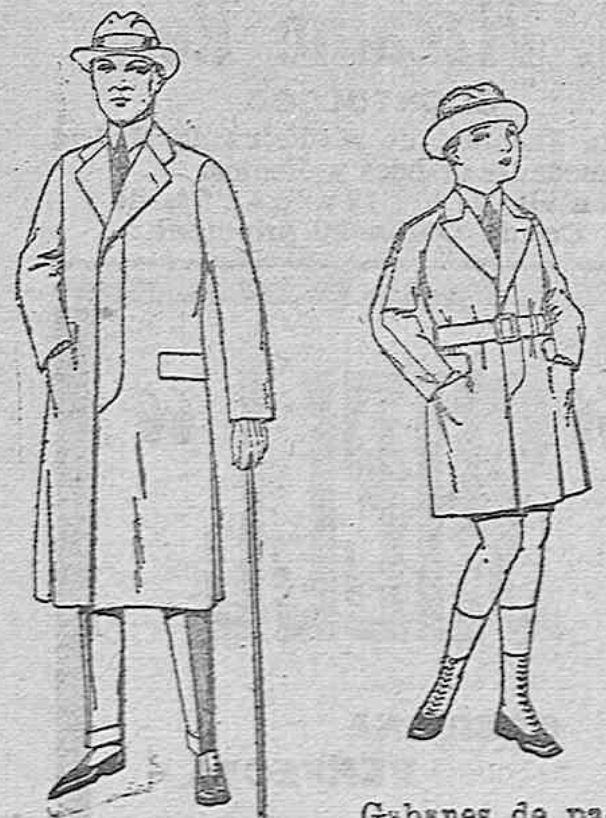
Gabanes de cheviot, gamuza o patén, etcétera de ptas. 45 a 140