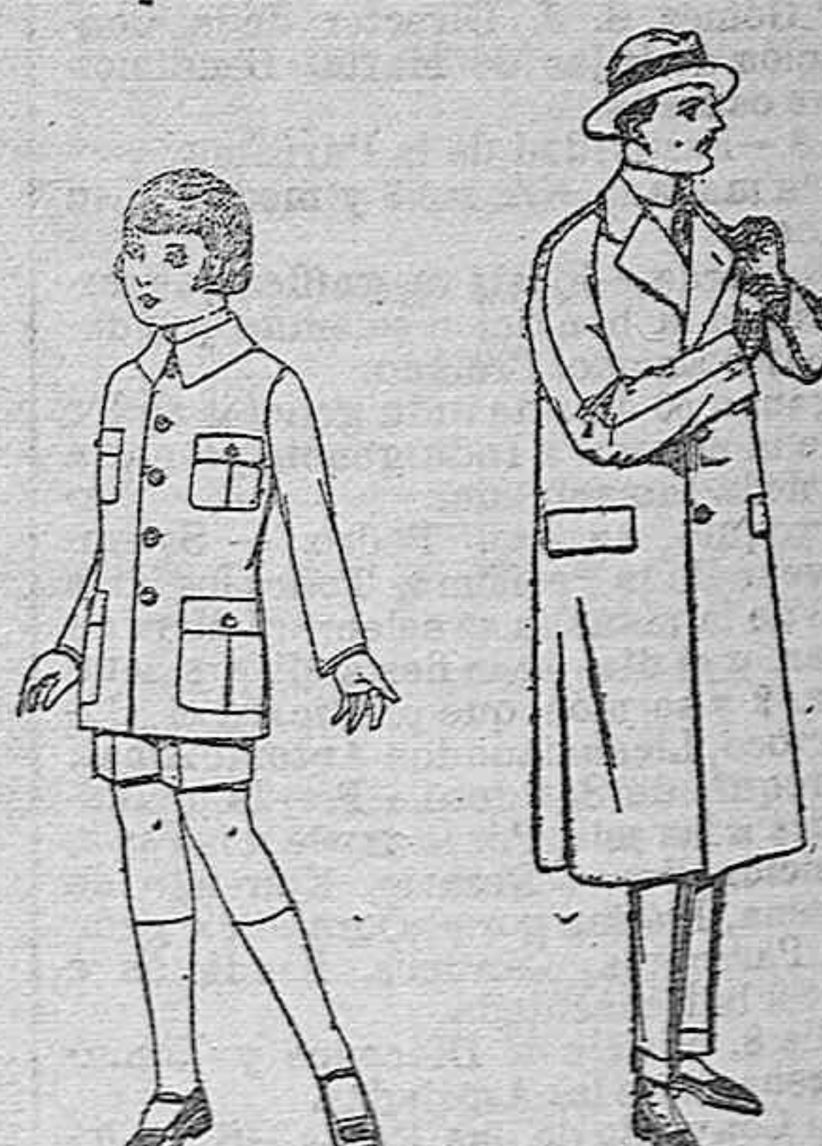
Trajes de patén modelo sport para niños de 4 a 9 años de ptas. 16 a 70.