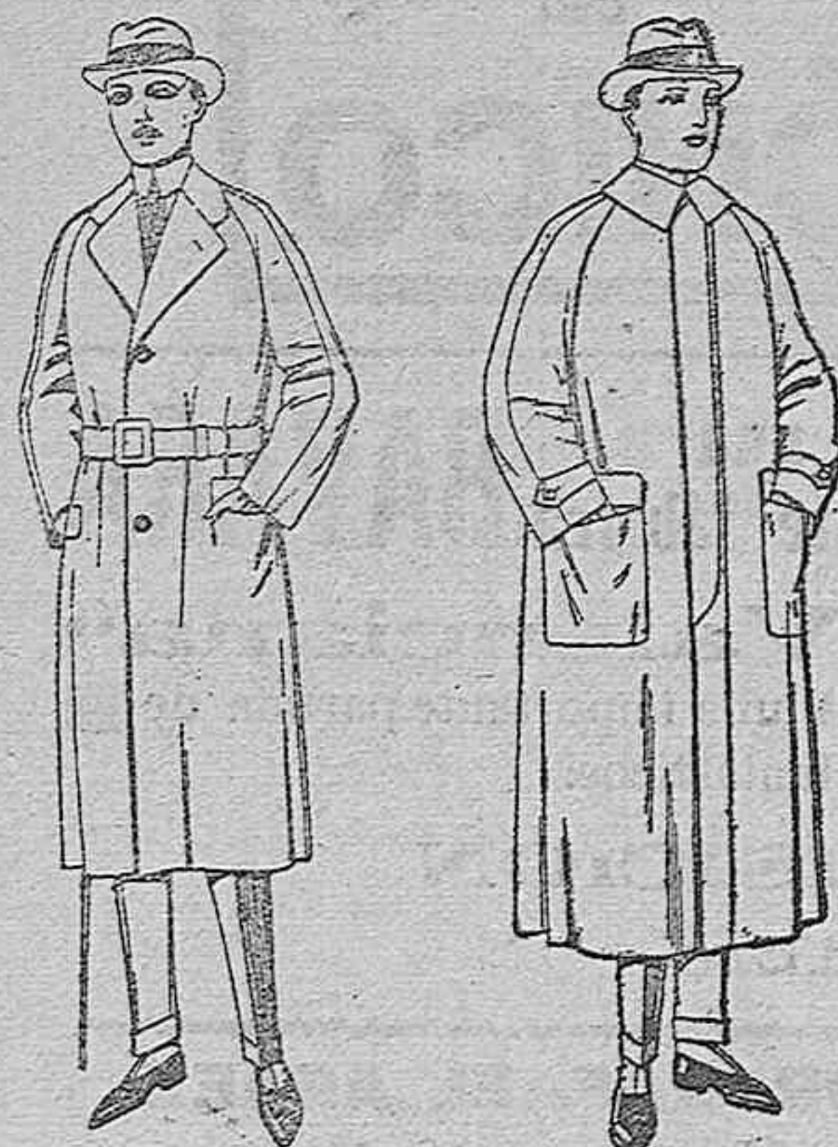
Gabanes regán de patén, gamuza o cover de ptas. 50 a 160

SUCURSALES: Madrid, Barcelona, Alicante, Bilbao, Cádiz, Cartagena, Gijón, Granada, Málaga, Palma de Mallorca, Santander, Sevilla, Valencia, Valladolid Zaragoza