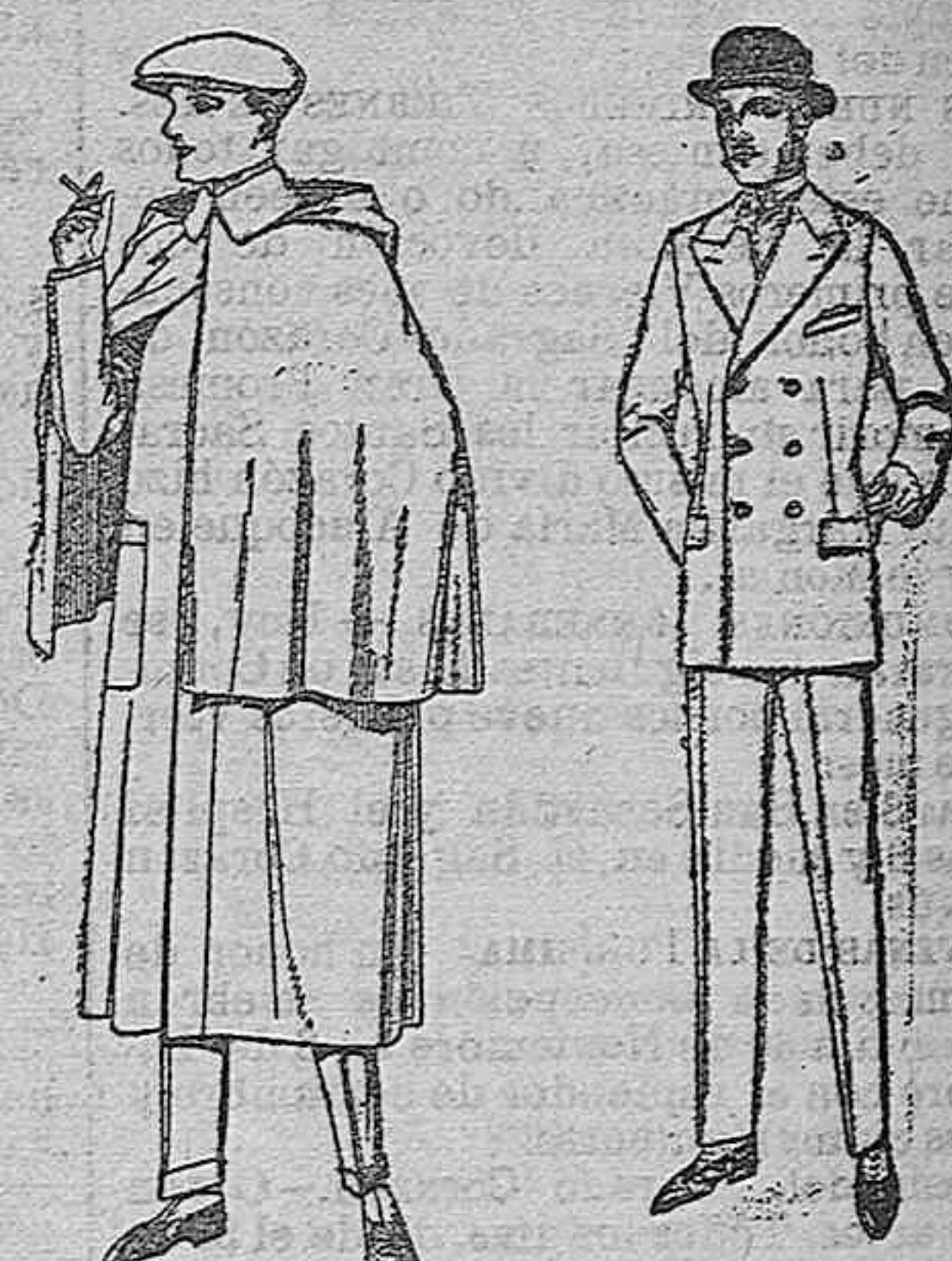
Impermeables mackferland en negro y azul de ptas. 85 a 175