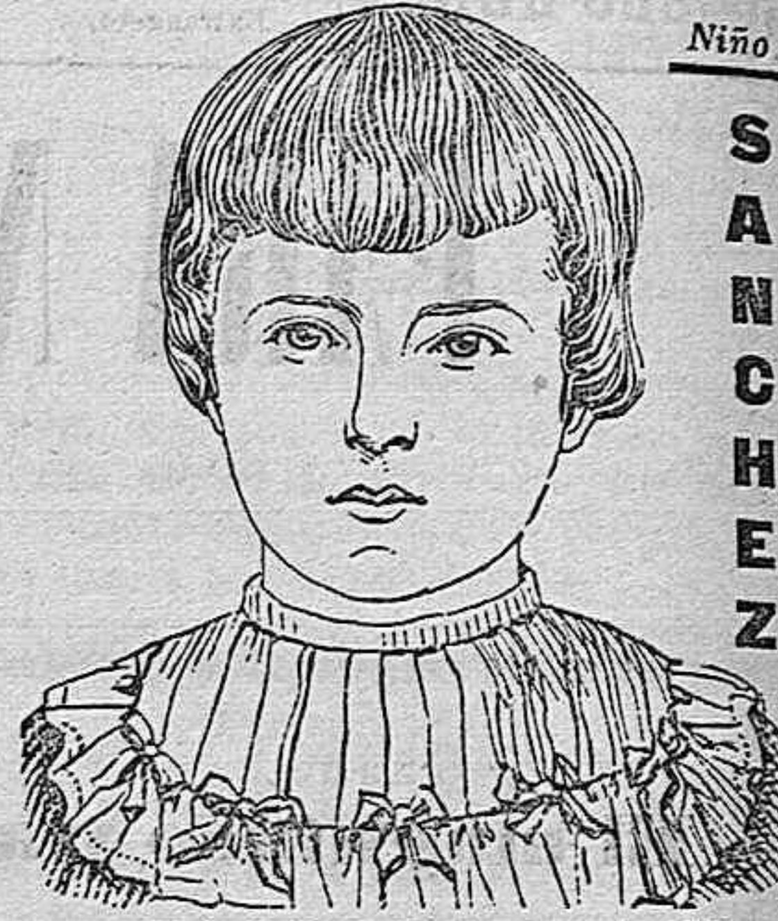
Madrid 40 de Diciembre de 1902.