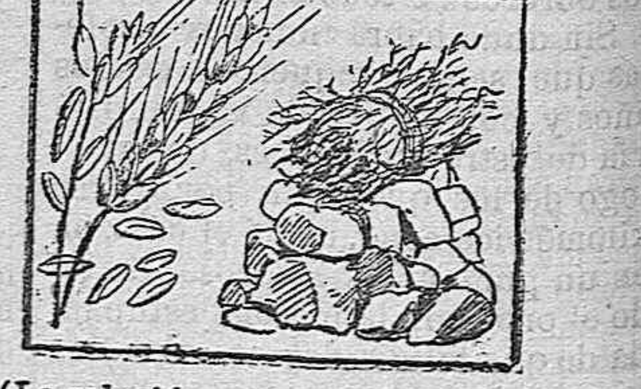
(La solución mañana).