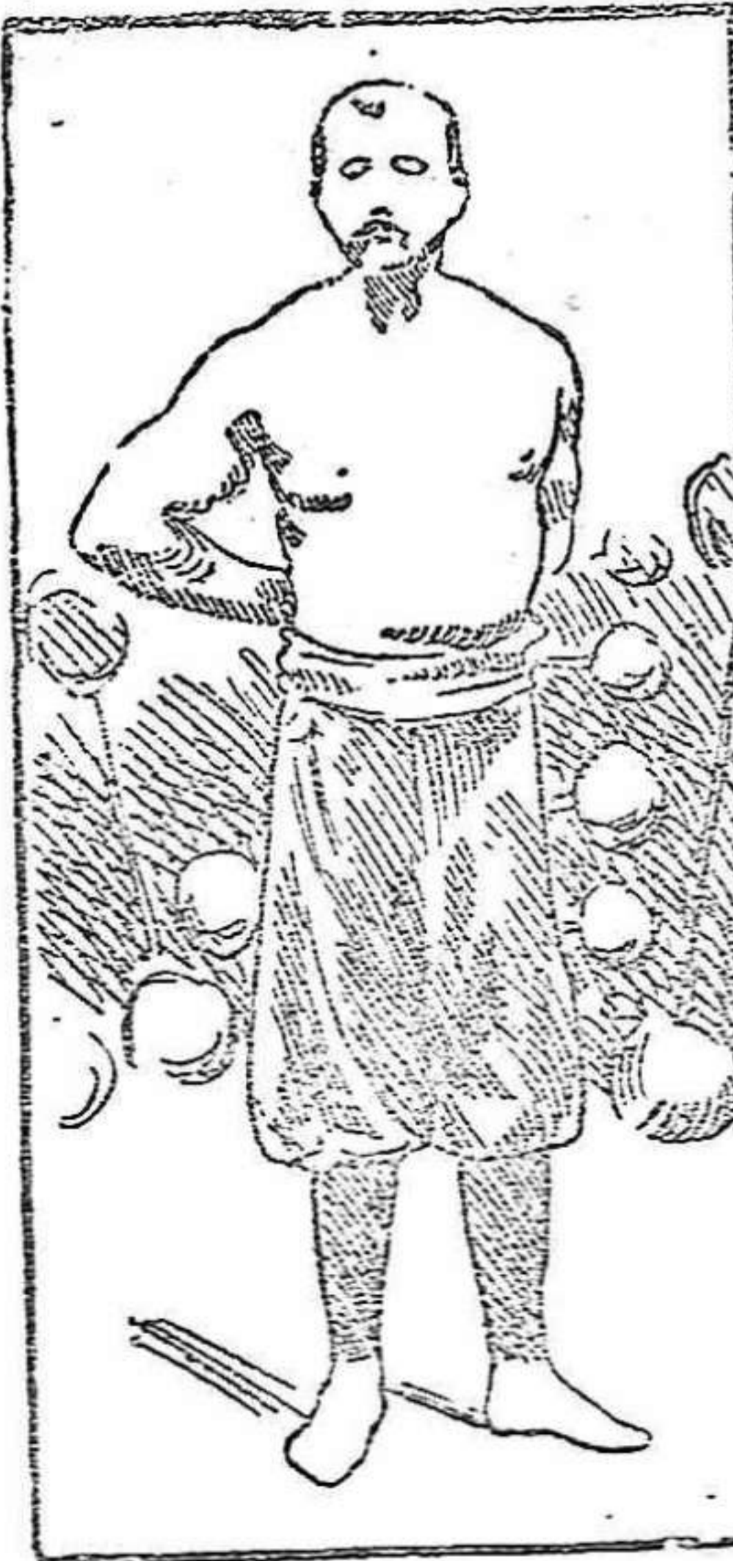
EL HOMBRE MAS FUERTE DEL MUNDO.

Tenemos el gusto de presentar á nuestros lectores al hombre que, oficialmente al menos, goza de más puños en el mundo entero, con lo