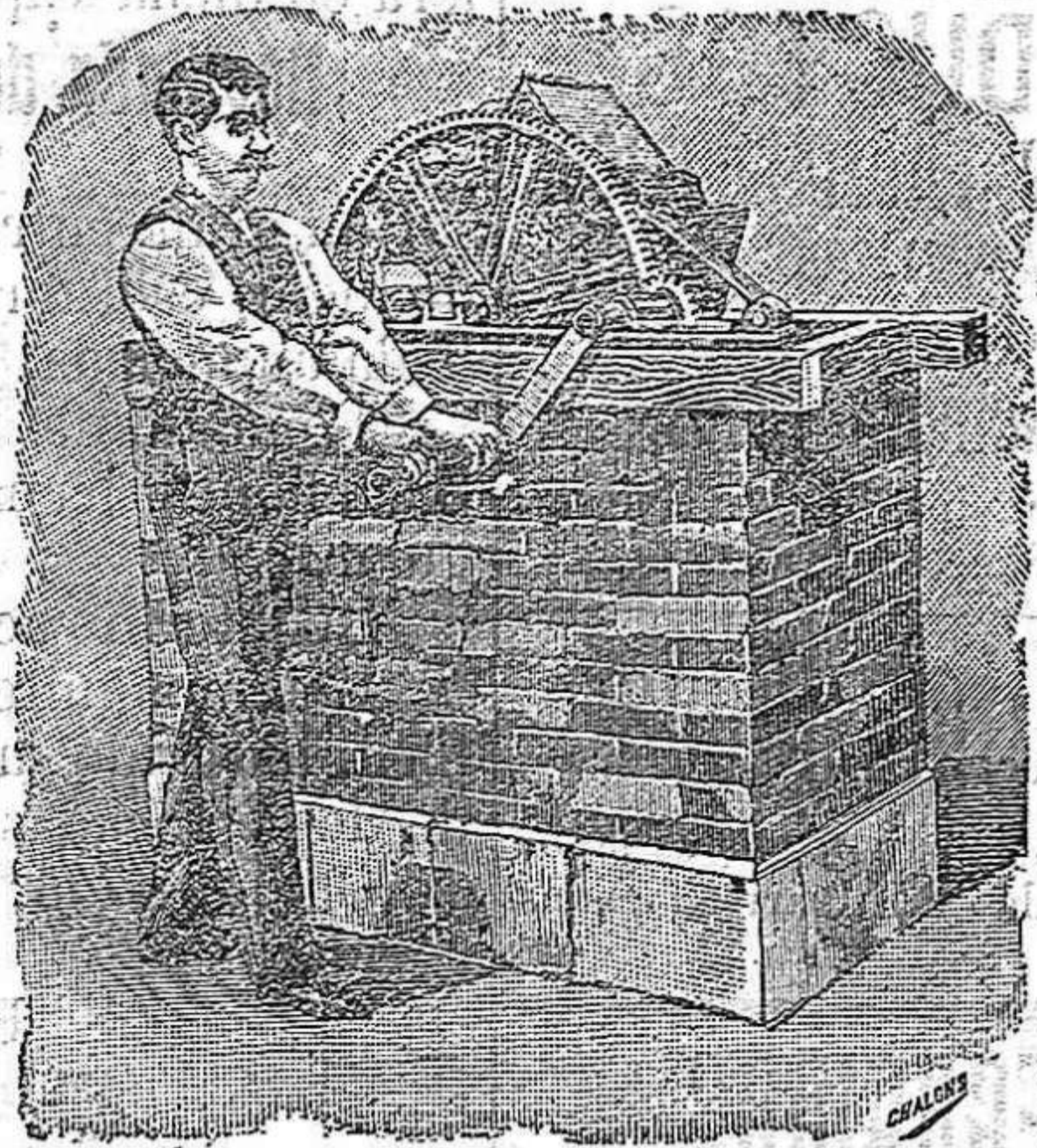
NORIA DEL NÚMERO 1 AL 5.