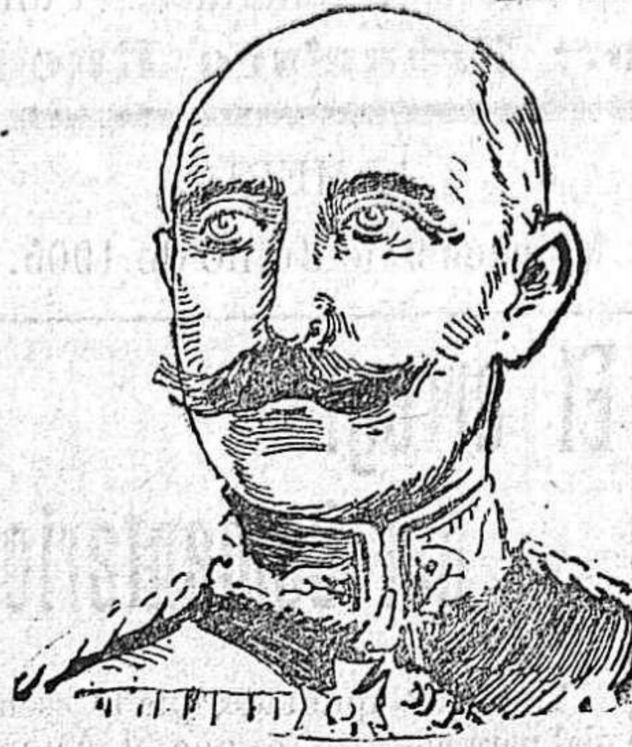
El duque de Connaught.