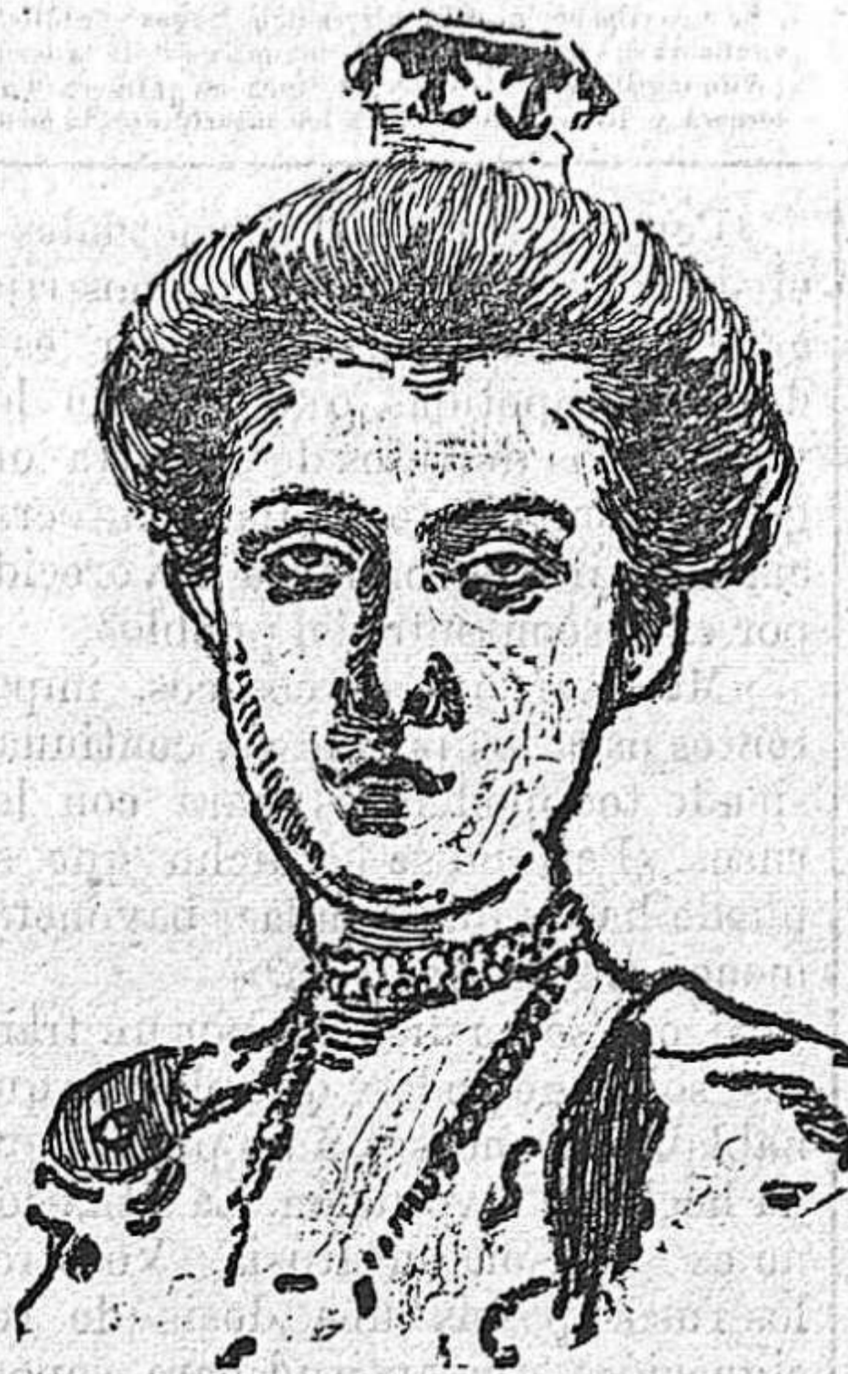
La Princesa Victoria Patricia futura Reina de España.