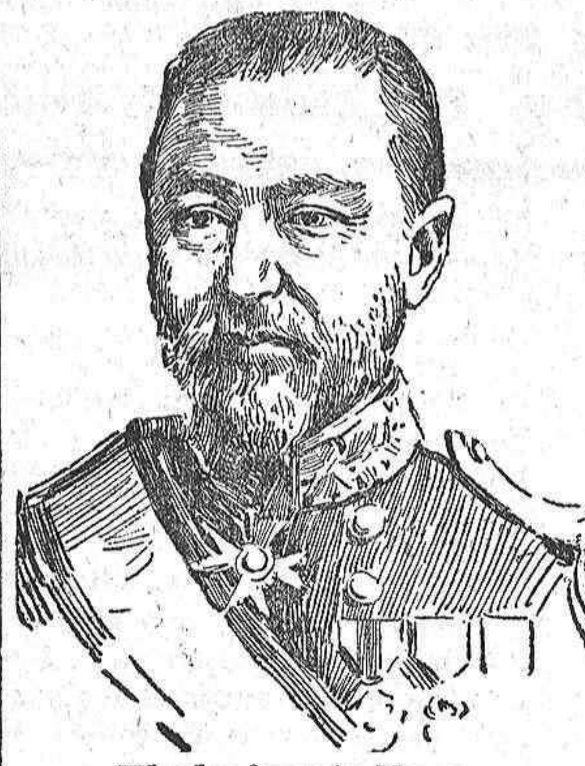
El almirante Togo.