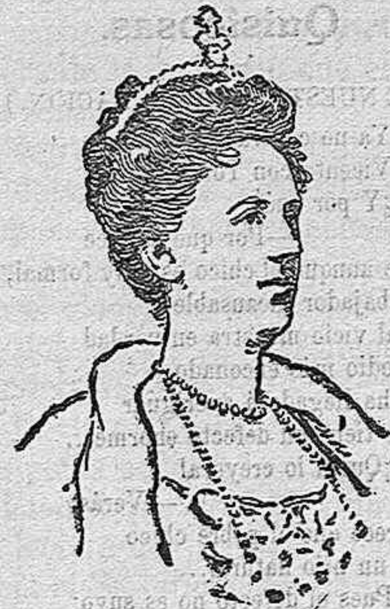
Ultimo retrate de la reina Guillermina.

Desde hace luengos años, viven tan profundamente, tan íntimamente unidos los Países Bajos y la Casa de Orange-Nassau, que si á ésta llegara á faltarles un heredero que recogiera de las sienas de la graciosa Guillermina la co-