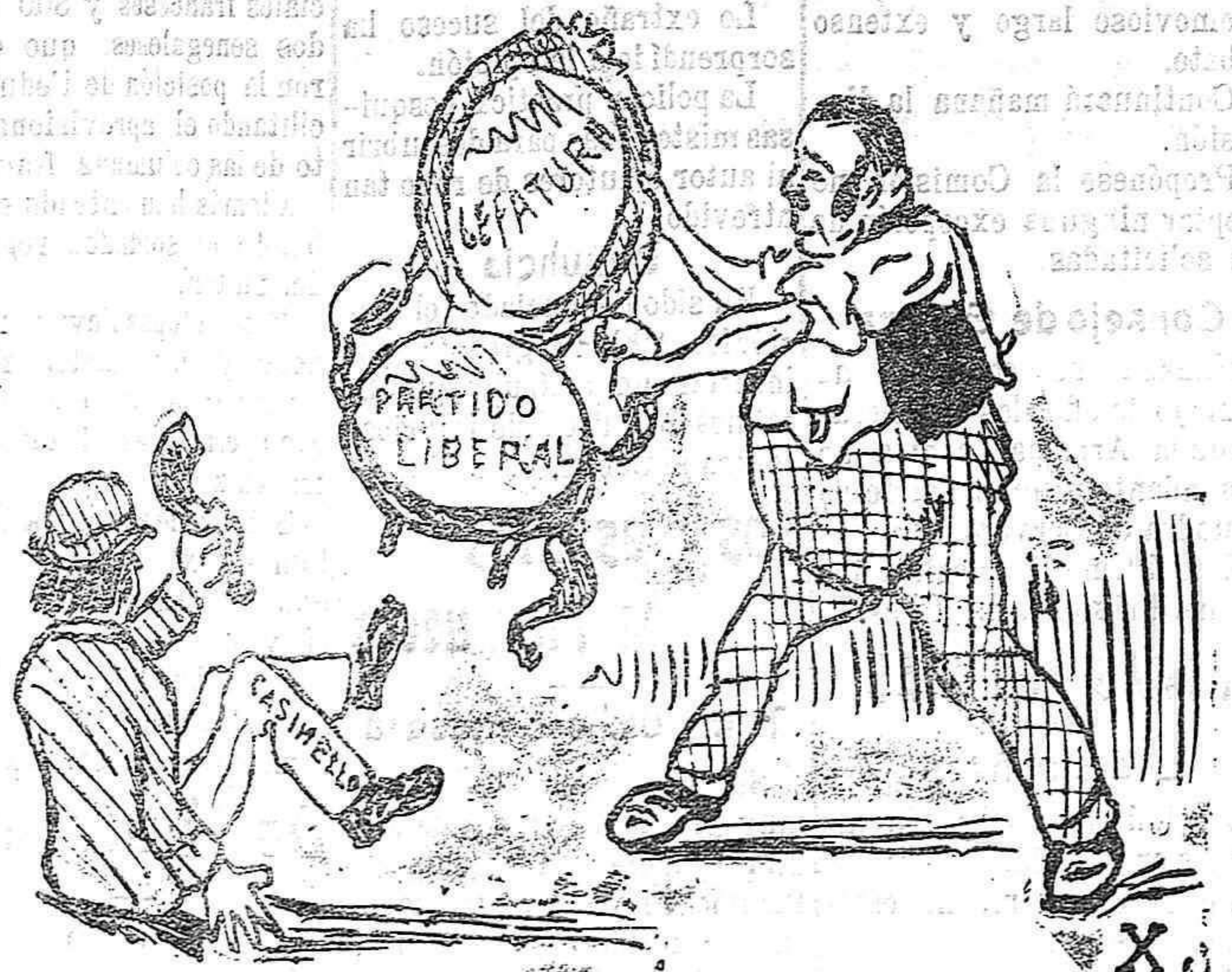
Como este sillón vetusto, el que se le caen las piernas, los liberales también están sin piés... ni cabeza.

Instalaciones Eléctricas y Mecánicas.—LUZ, MOTORES, TIMBRES, BOMBAS, MOLINOS Precios sin competencia.—Garantía absoluta.—Castelar 2 Almería