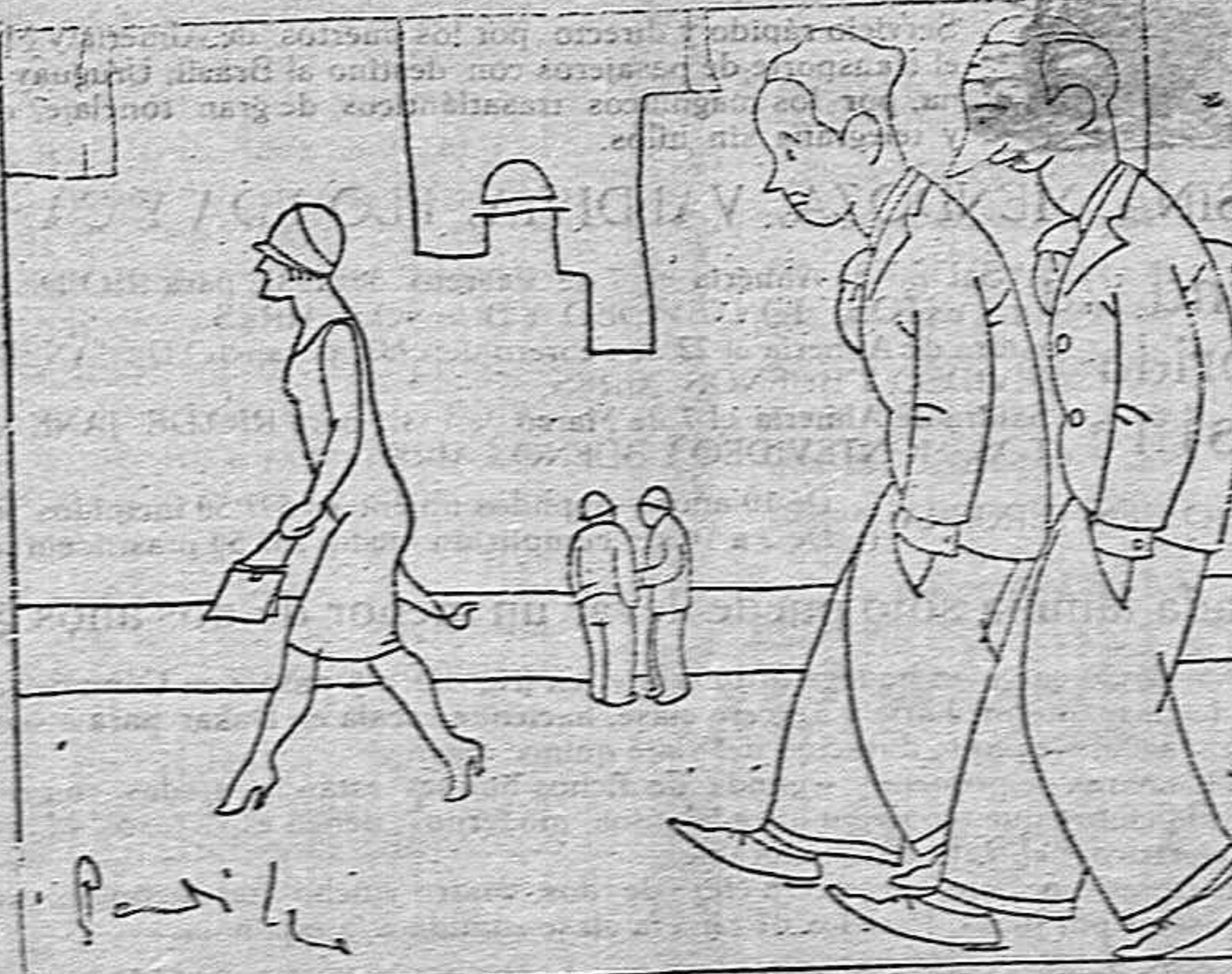
IMPRESIONISMO —Esa es la única mujer cuyo corazón no he logrado impresionar. —¿Has probado con un diamante?

Madrid, 27-12 noche. Se ha reunido el Consejo de Sanidad para tratar de la epidemia gripal y de las medidas que se han de poner en práctica para atajar el mal. Se acordó proponer al Gobierno que ordene suspensa la concentración de reclutas provisionalmente.