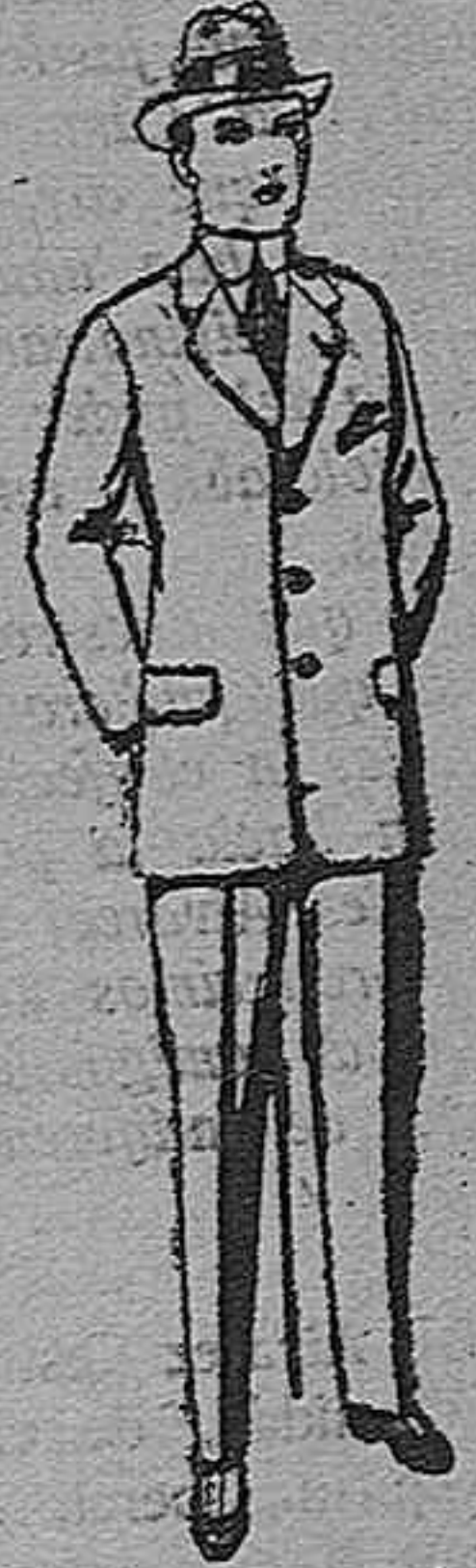
Trajes de patén, vicuña o jerga, para niños de 10 a 12 años. De pesetas 15 a 50.