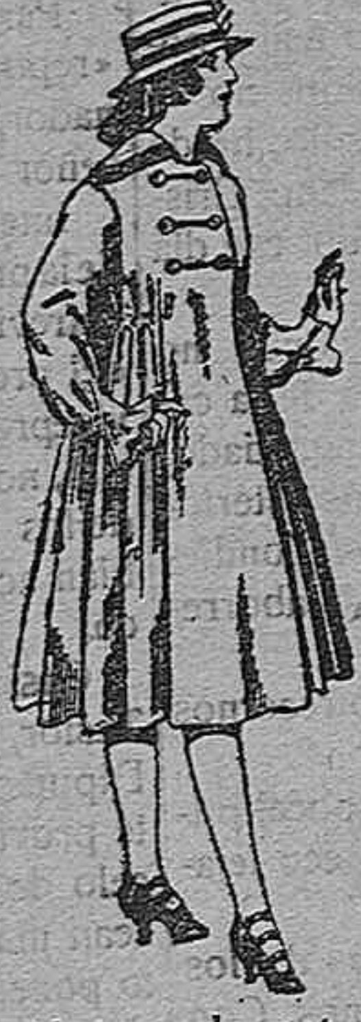
Abrigos de pat para jovencitas 11 a 15 años en De pts 35 a 50 de