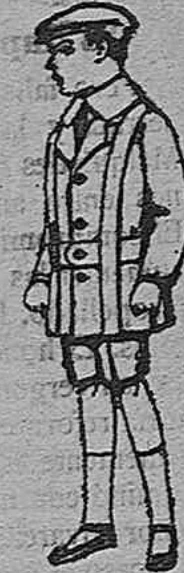
Trajes de patén para niños de 4 a 9 años. De pts. 12 a 33