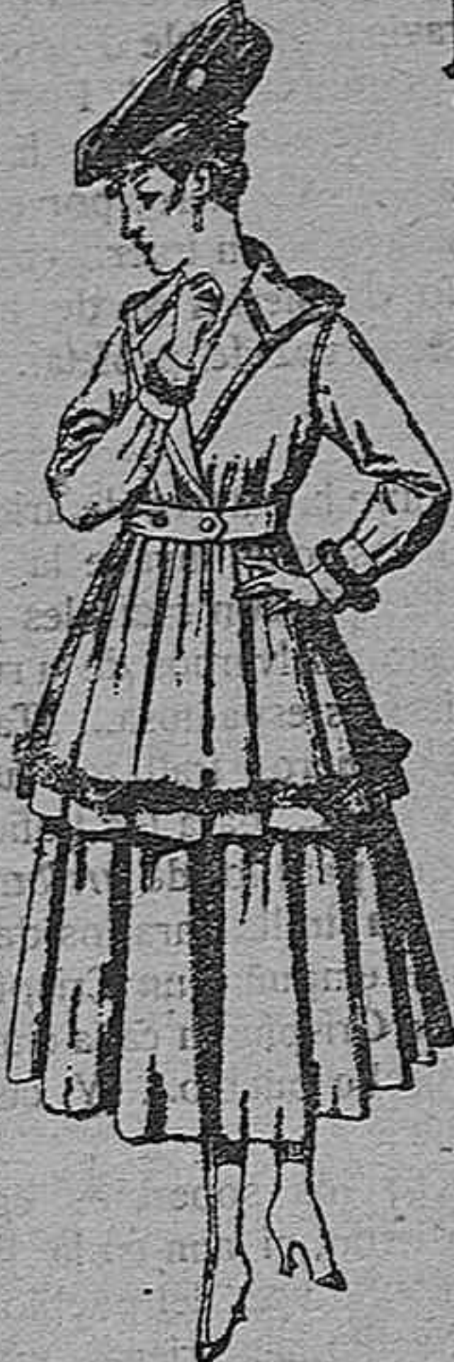
Gabanes de patén o cheviot, con cinturón. De pesetas 50 a 110. Los mismos a medida. De pts. 65 a 145.