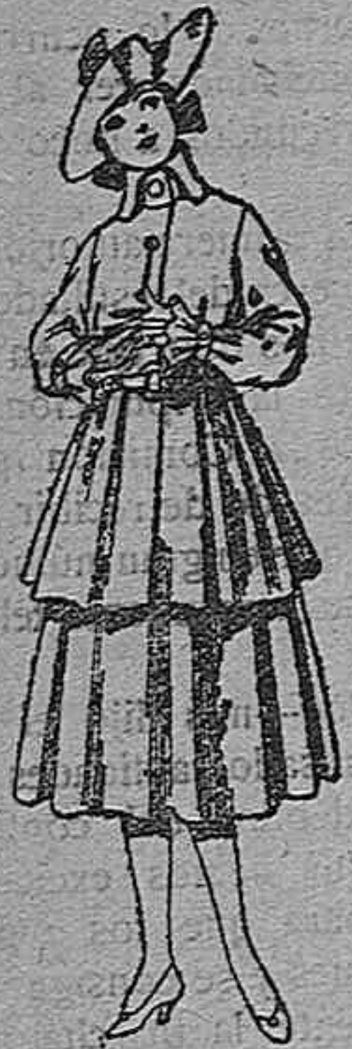
Trajes de lana, para jovencitas de 12 a 15 años. De pts 45 a 55.