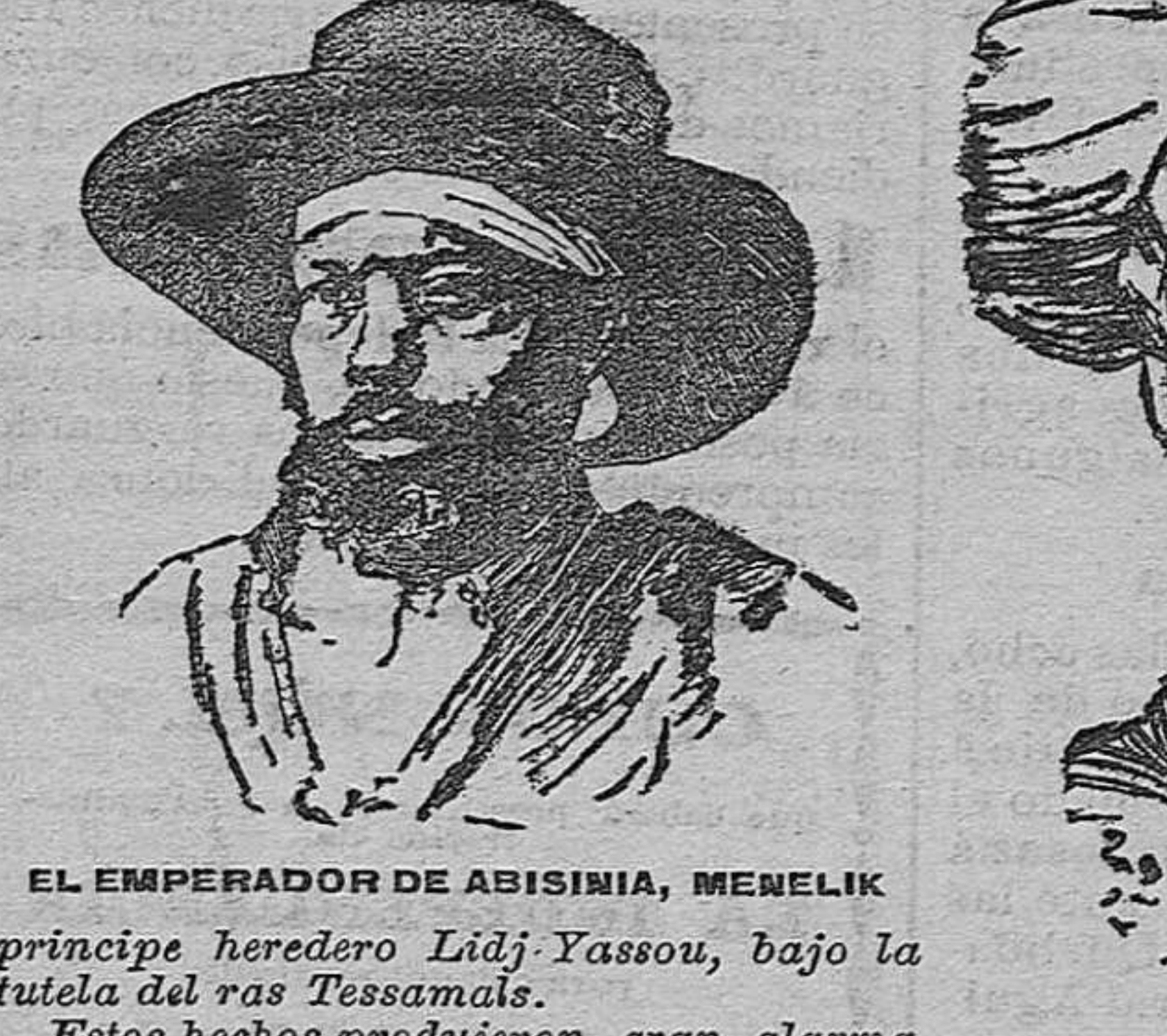
EL EMPERADOR DE ABISINIA, MENELIK