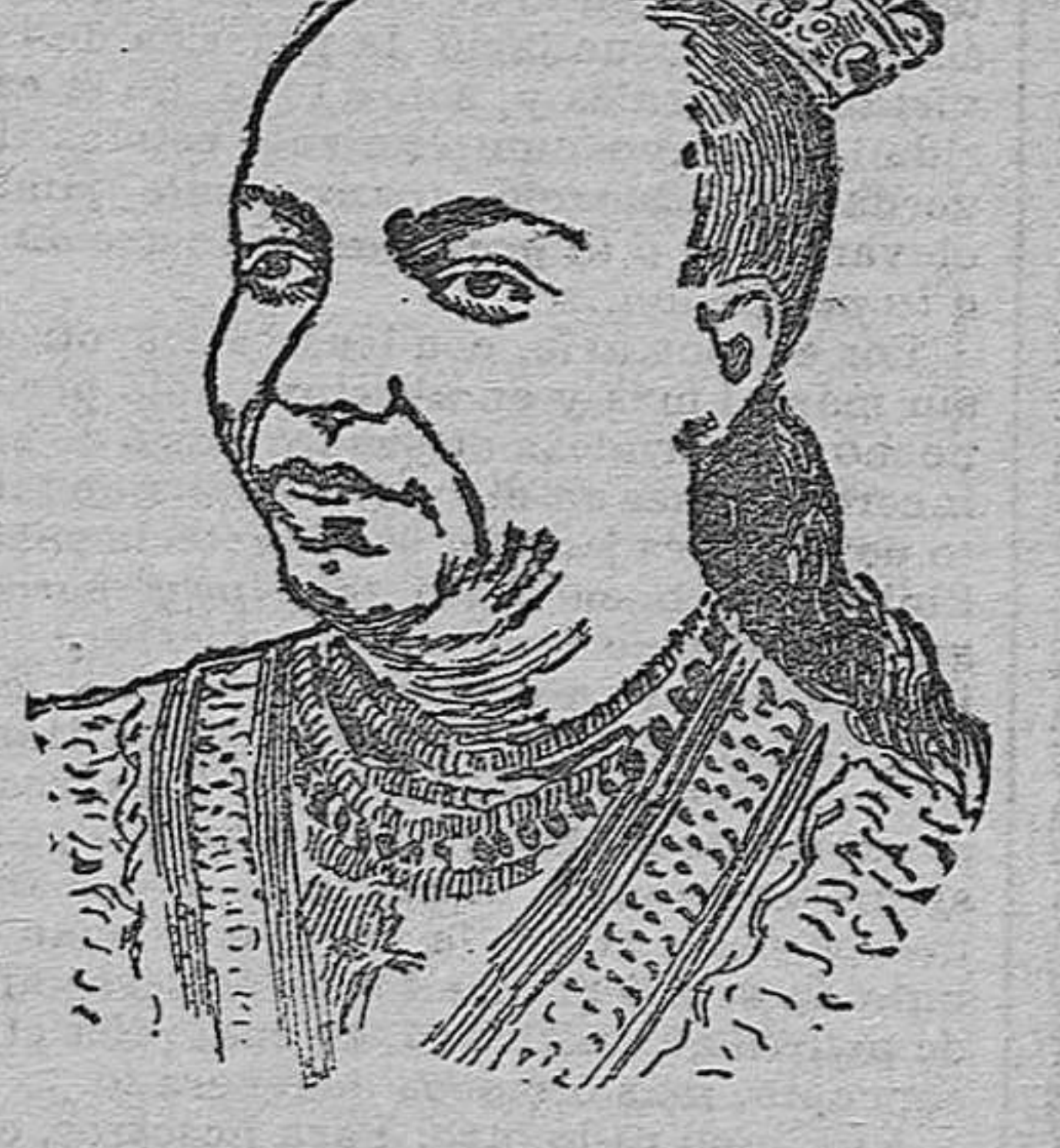
LA EMPERATRIZ TAITU, DE ABISINIA, ESPOSA DE MENELIK

dis-Abaka nada en concreto dicen, por rodear el más impenetrable misterio cuanto se refiere á la existencia del viejo emperador.