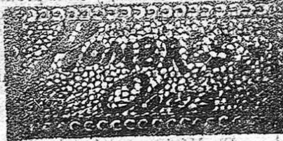
Saban y Larroya.