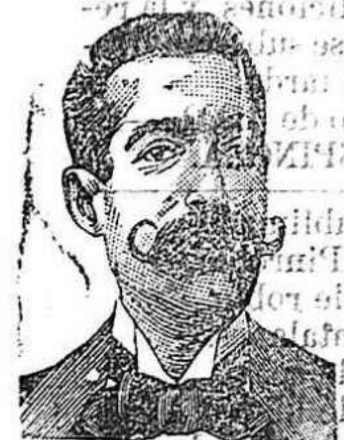
Salvati Costanzi Diputación 435-Barca