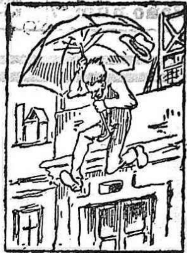
La solución mañana.