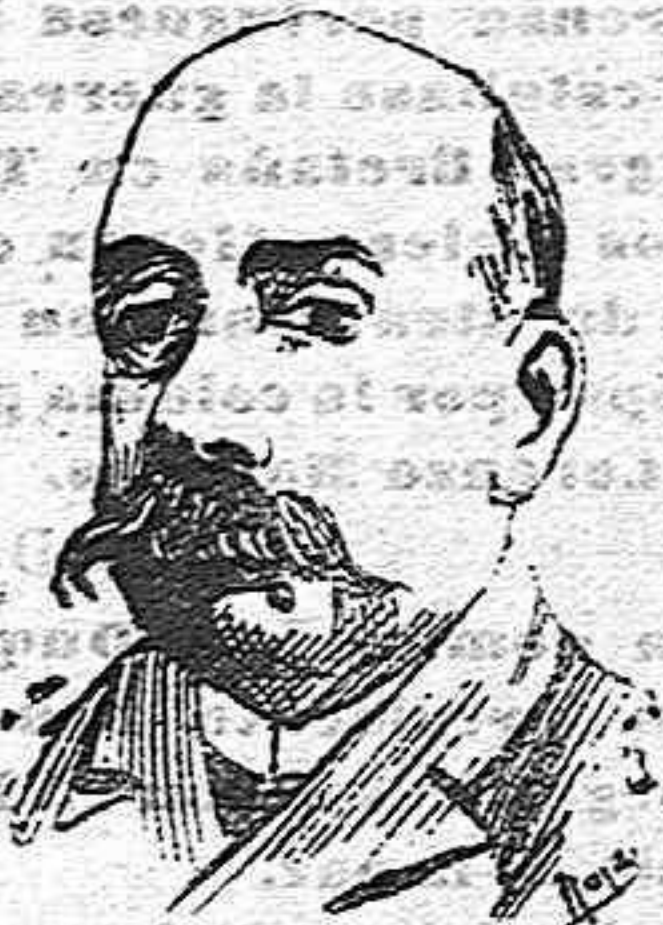
D. EMILIO CASTELAR Y RIPOLL.