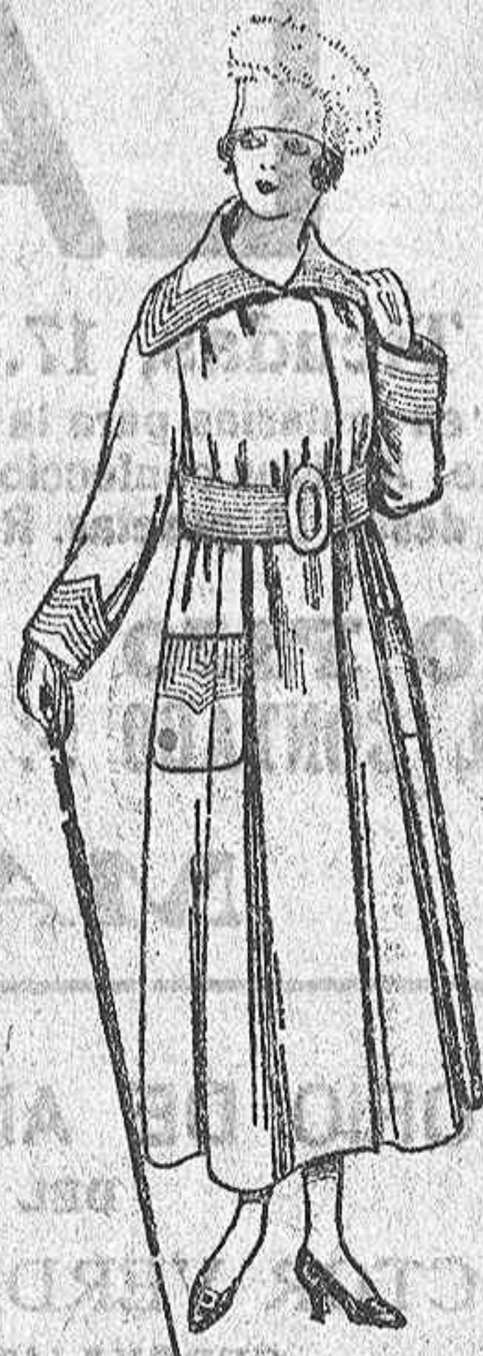
Abrigos de cheviot, gamuzas, etc. De ptas. 50 a 60.