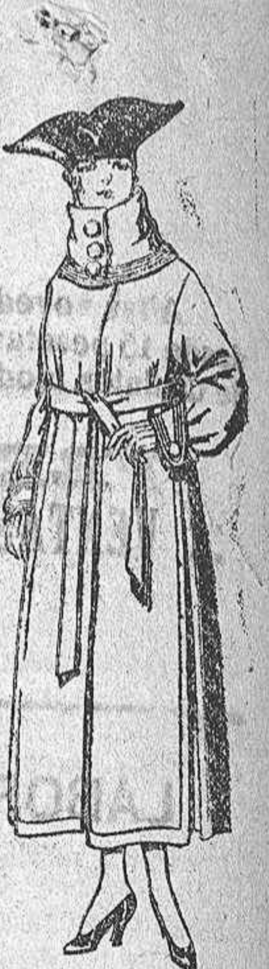
Abrigos de pañete, colores azul, beig y café. De ptas. 65 a 85.

Ultima novedad en echarpes, manguitos, pelerinas, corbatas, abrigos, etc., en pieles de leopardo, taupe, vison, renard, zibeline, armiño, etc., auténticas e imitación perfecta