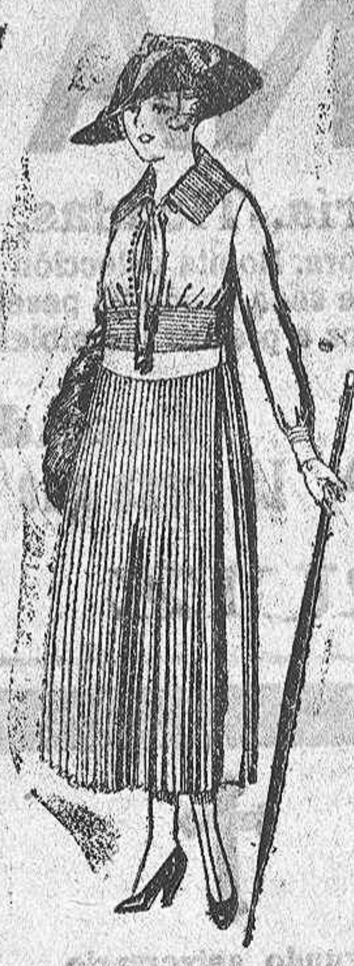
Vestidos de sarga inglesa, en negro, azul y color, corbata de punto. De ptas. 72 a 85