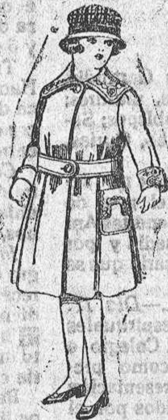
Abrigos de cheviot, pañete, etc., color, bordados, para niñas de 4 a 9 años. De ptas. 24 a 28.