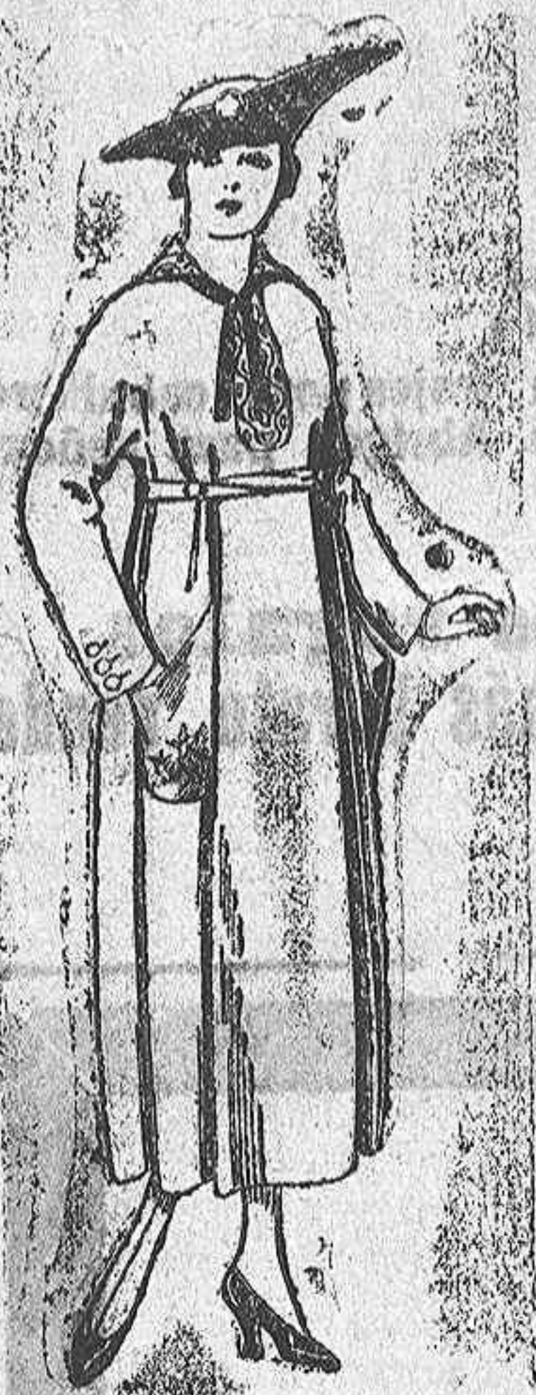
Vestidos de gabardina, estambre, etc., en color azul, bordados. De ptas. 53 a 60. Los mismos, en punto de lana "Djers" bordado De ptas. 93 a 112.

Ropas confeccionadas para Caballero, Señora Niño y Niña