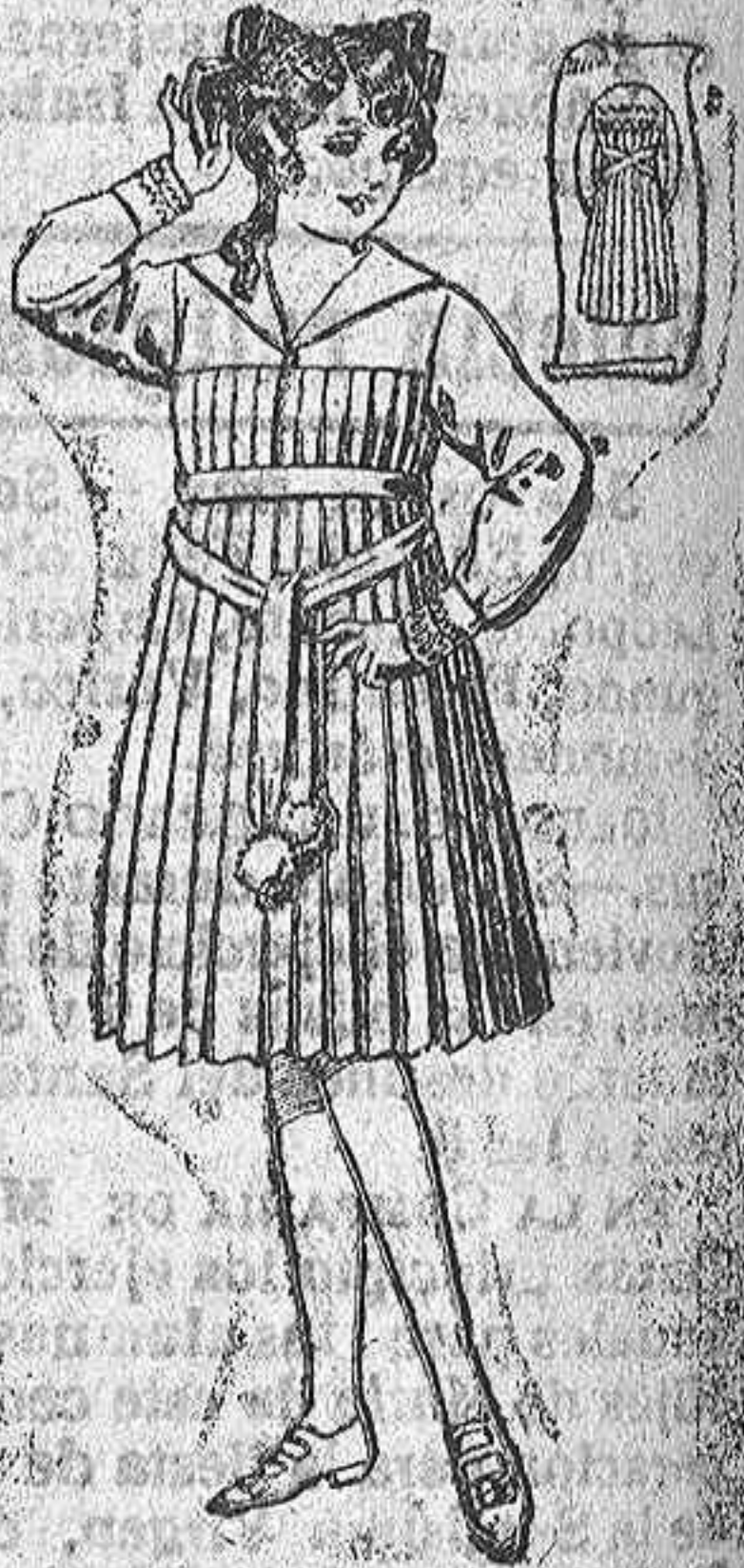
Vestidos de estambre, azul y color, adornos bordados, para jovencitas de 12 a 15 años. De ptas. 40 a 50.