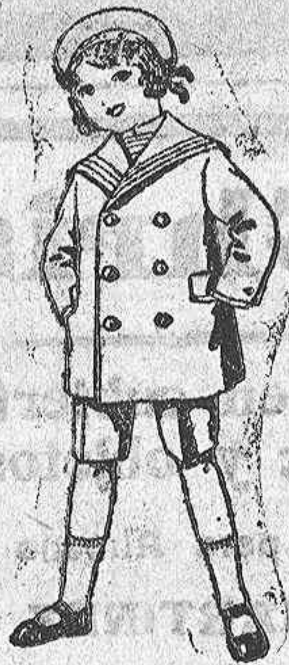
Trajes modelo "Motel" de vicuña o jerga azul, para niños de 4 a 9 años. De ptas. 14 a 34.