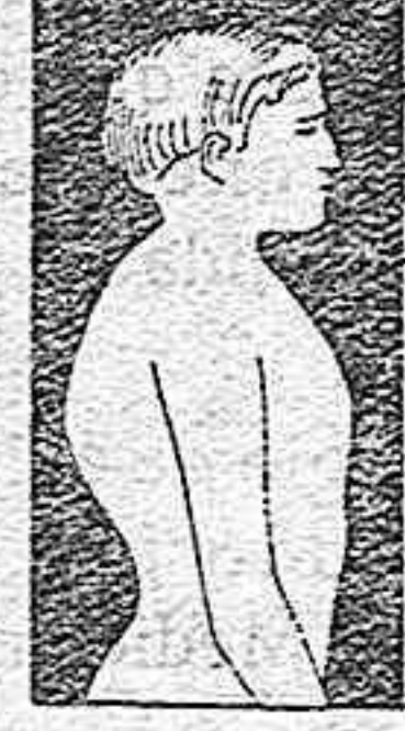
MAL DE POTT