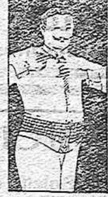
FAJA DE CABALLERO