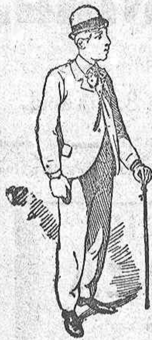
(La solución mañana).