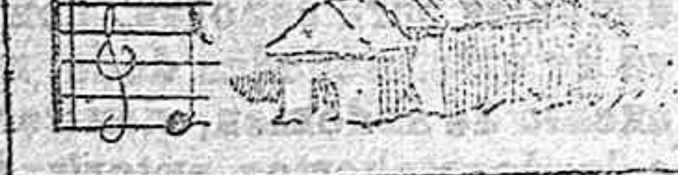
(La solución mañana.)