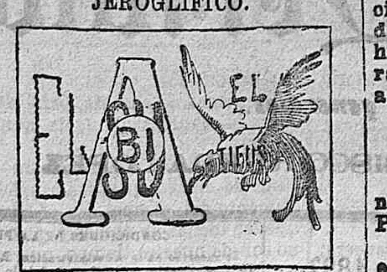
(La solución mañana.)

Solución a la charada en acción de ayer: Caraballo.