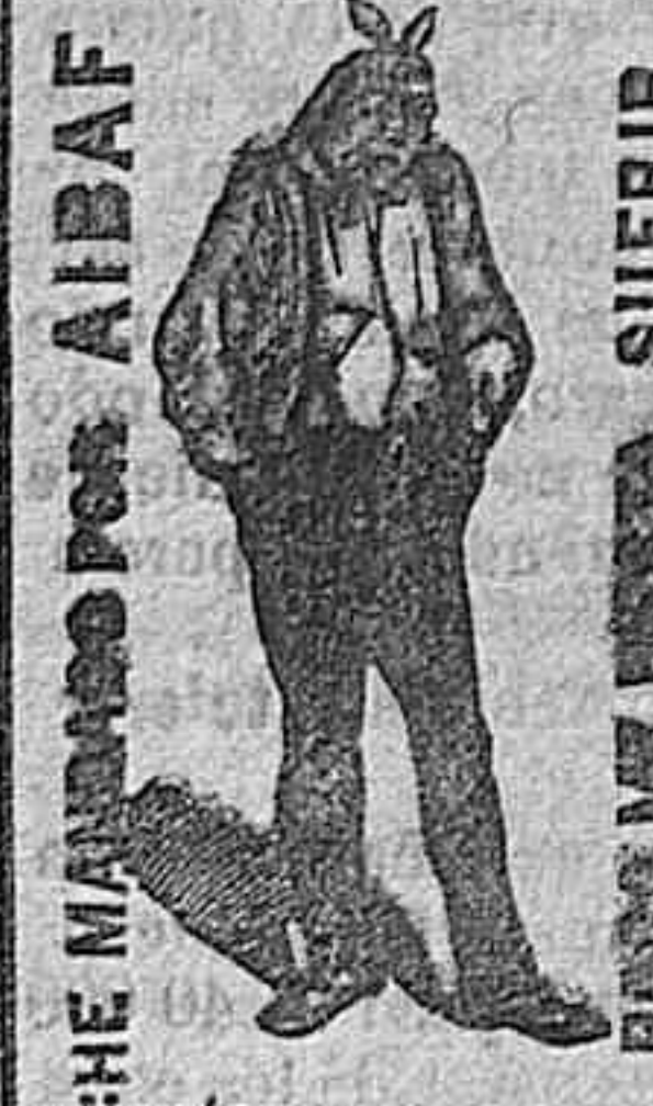
HE MARRADO POR AIBAF