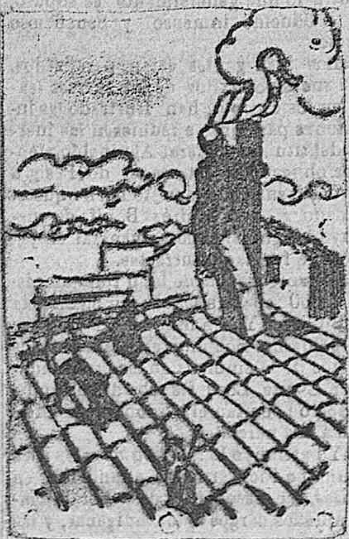
Idilio del mes de Enero.