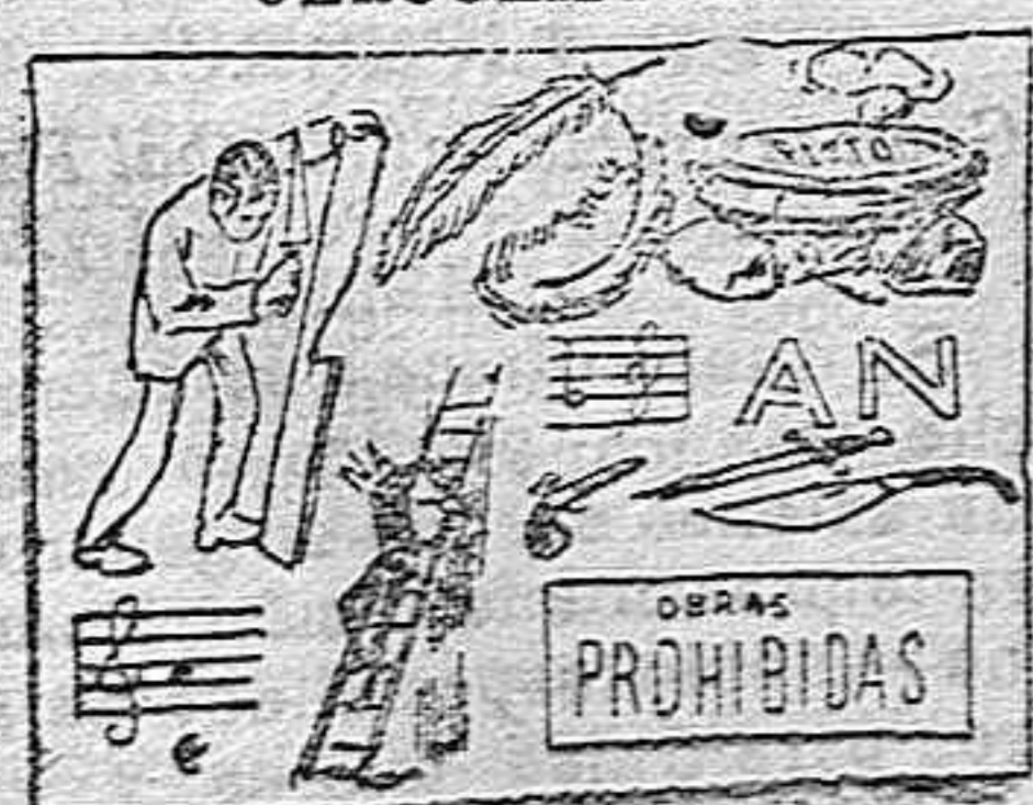
(La solución mañana.)