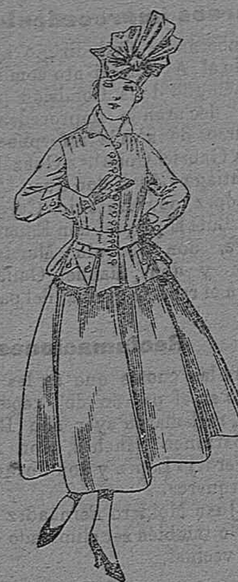
Trajes de lanilla negra, azul y color A pesetas 70