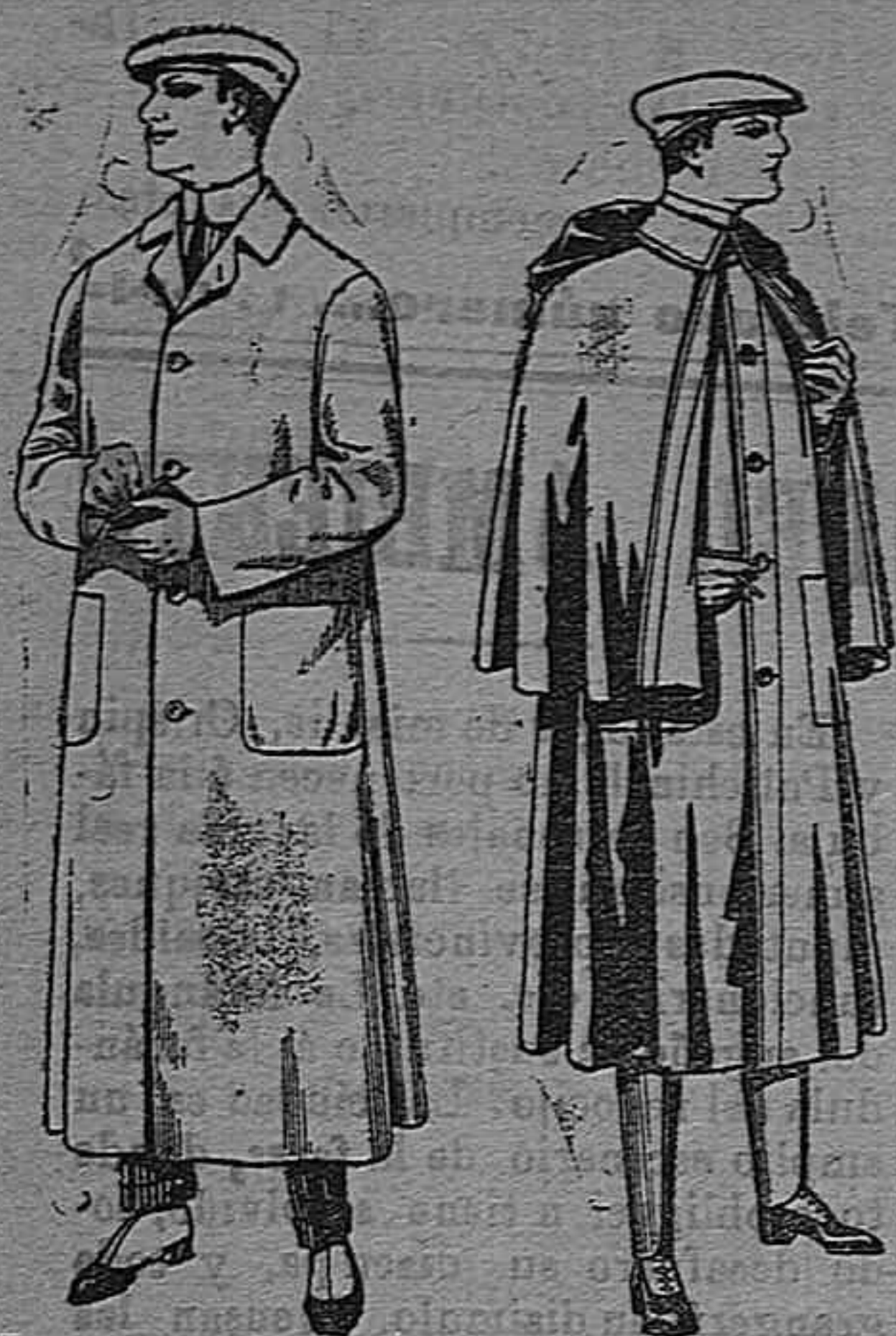
Impermeables forma Guardapolvos de dril mack-rland en negro y azul De pesetas 55 á 100 De pesetas 6 á 11

Gran exposición de artículos para la temporada