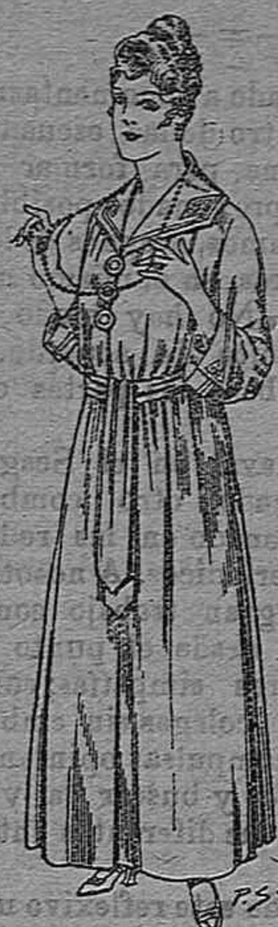
Bata de crepón color, cuello bordado De pesetas 6 á 11