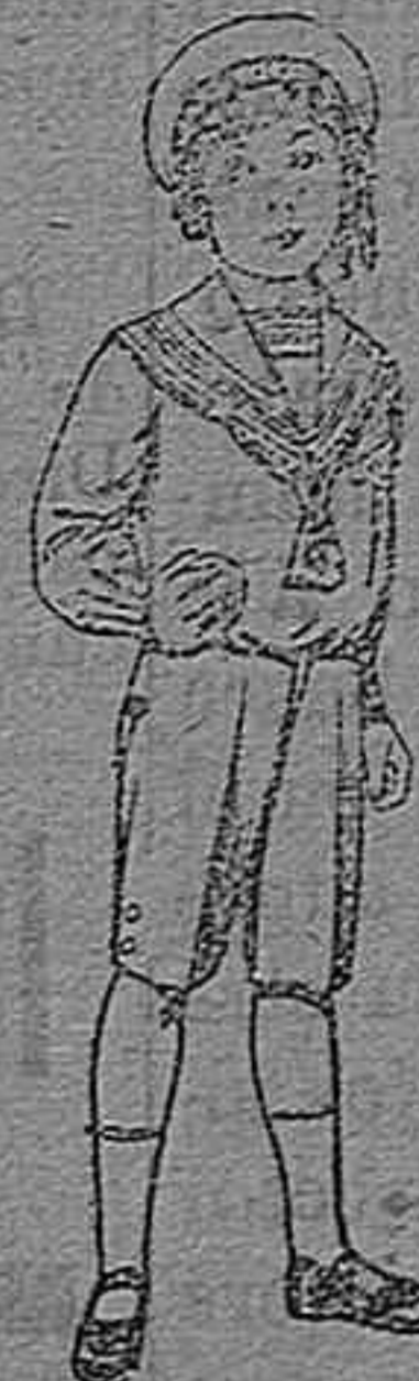
Trajes marinera de vicuña azul, para niños de 4 á 9 años. Pt. 6 á 20