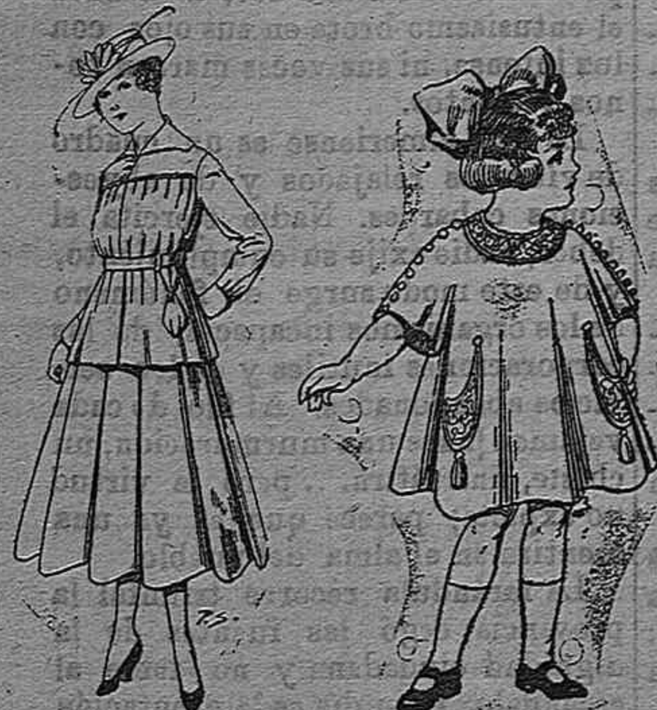
Trajes de lanilla Bestidos de lanilla para niñas de 4 á 9 años De pesetas 30 á 38