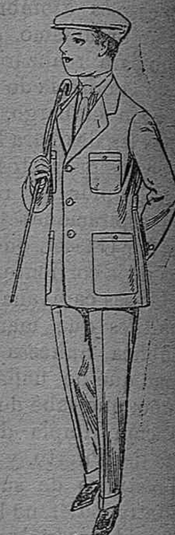
Trajes modelo Sport de dril listado para jóvenes de 10 á 16 años. De pesetas 11 á 17