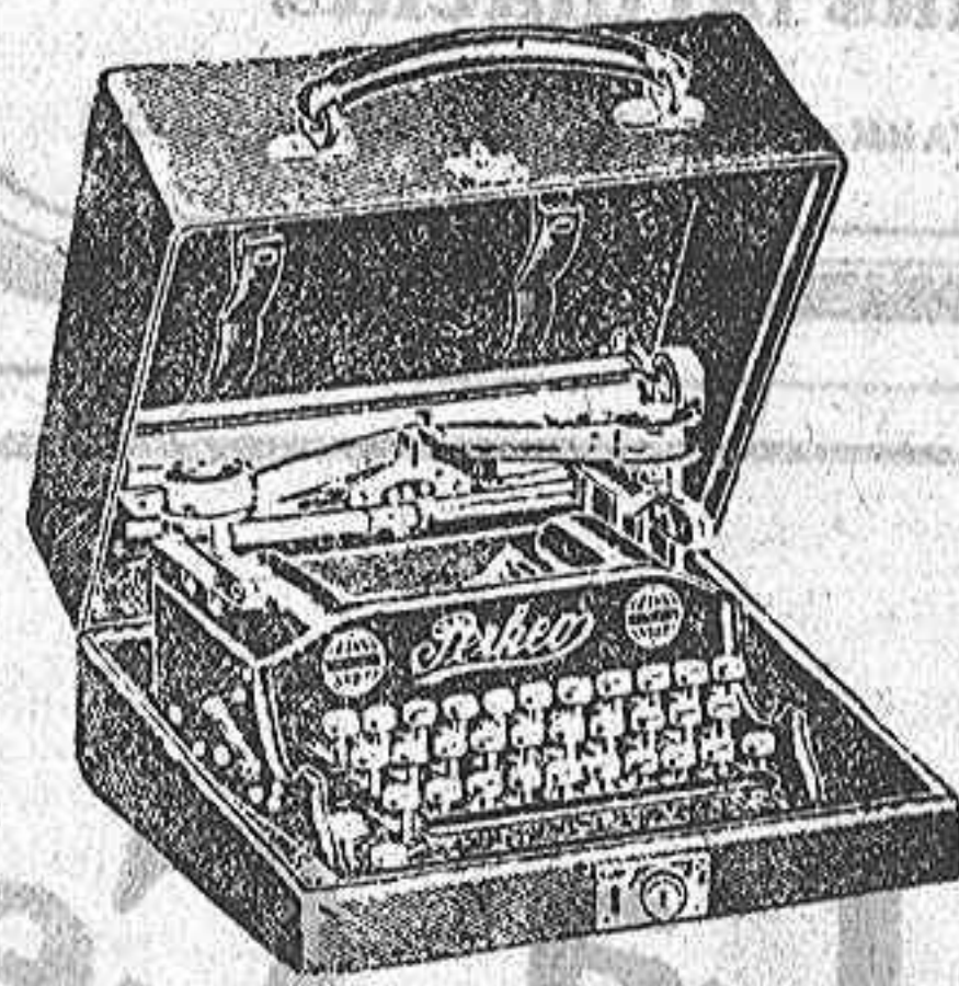
La más indicada para uso particular, pequeños negocios, viajes