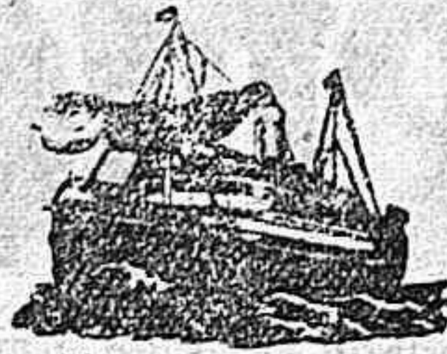
El correo trasatlántico