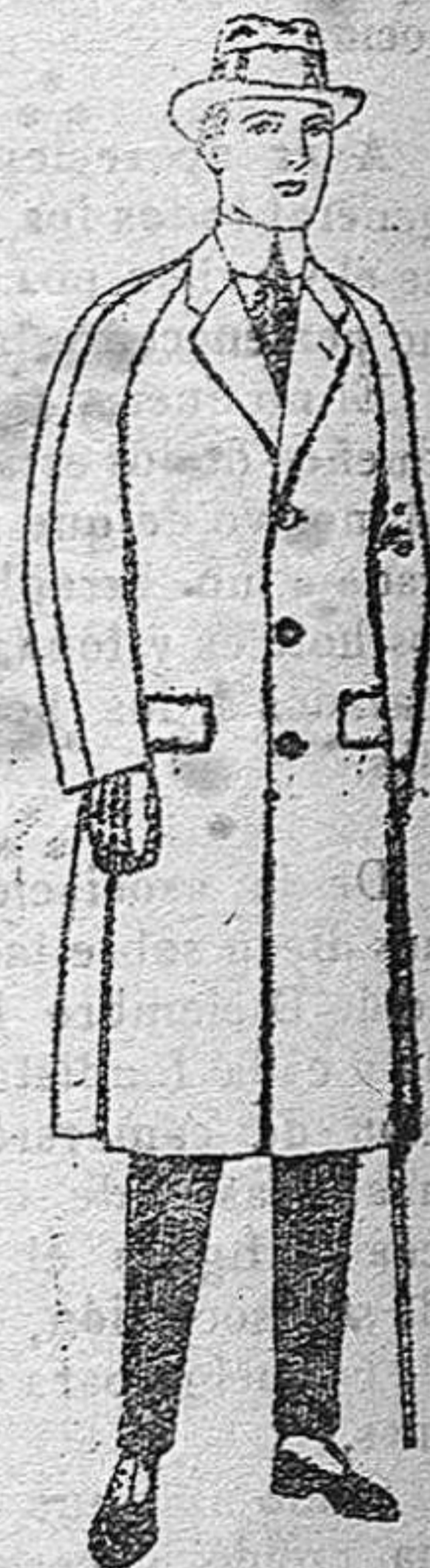
Gabanes de patén, melton o cheviot, con forro de seda, satén o escocés. De ptas. 68 a 185.