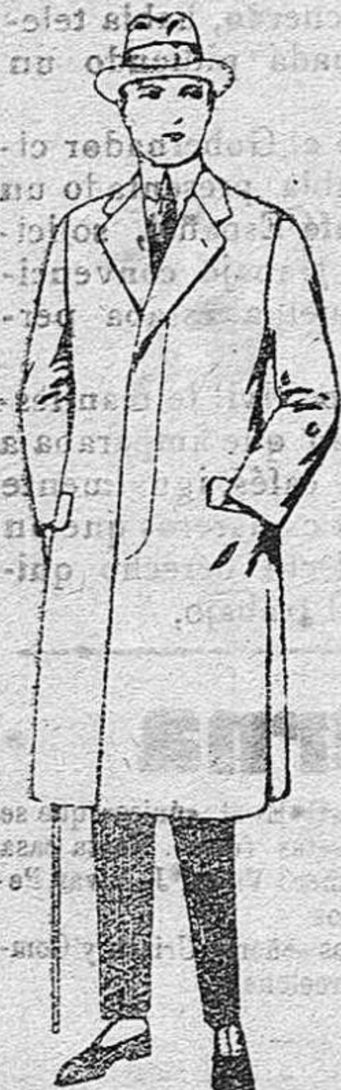
Gabanes de cheviot, gamza, patén, etc. De pesetas 55 a 70.