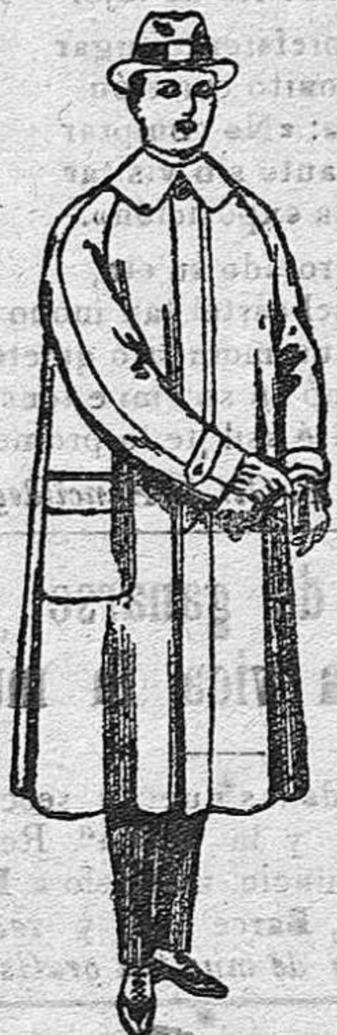
Impermeables, forma gabán. De ptas. 40 a 125.