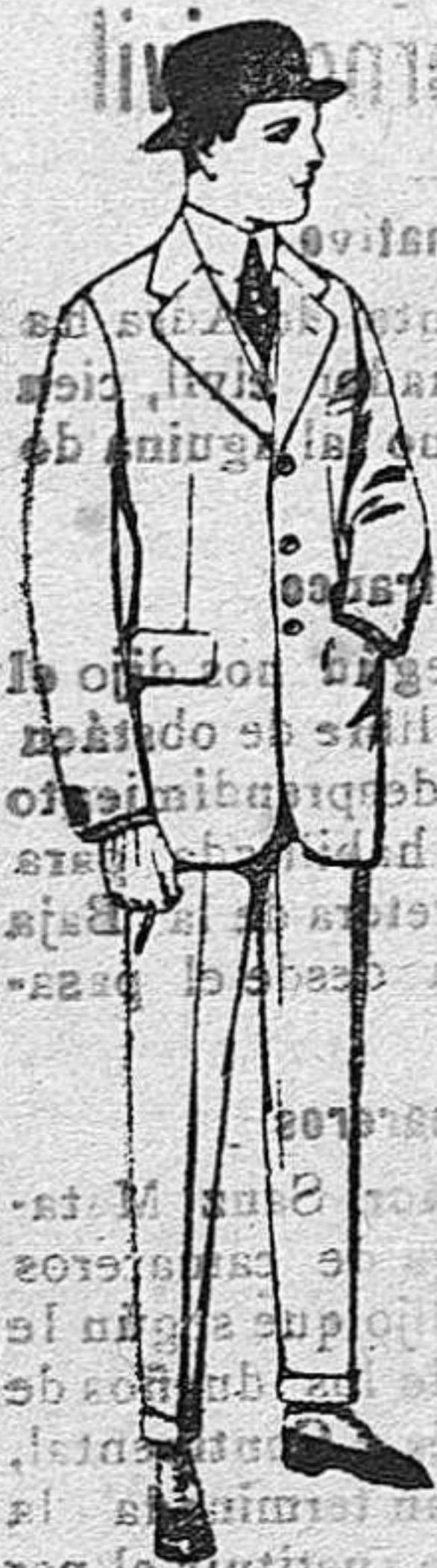
Trajes de cheviot, melton, vicuña o jerga. De ptas. 47 a 190.

SUCURSALES: Madrid, Barcelona, Alicante, Bilbao, Cádiz, Cartagena, Gijón, Granada, Málaga, Palma de Mallorca, Santander, Sevilla, Valencia, Valladolid, Zaragoza.