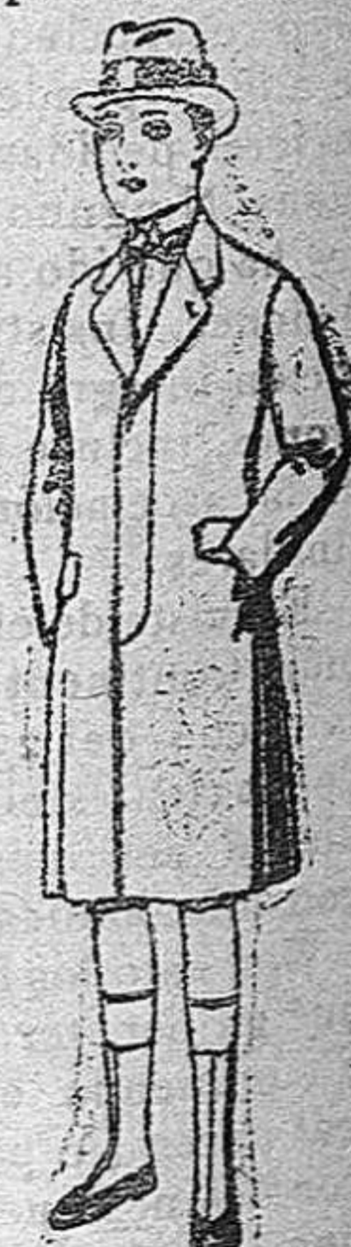
Gabanes de patén para niños de 10 a 12 años. De pesetas 35 a 62.