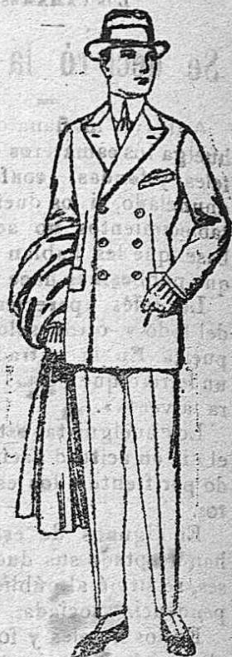
Trajes de cheviot melton, vicuña o jerga. De pesetas 55 a 190.