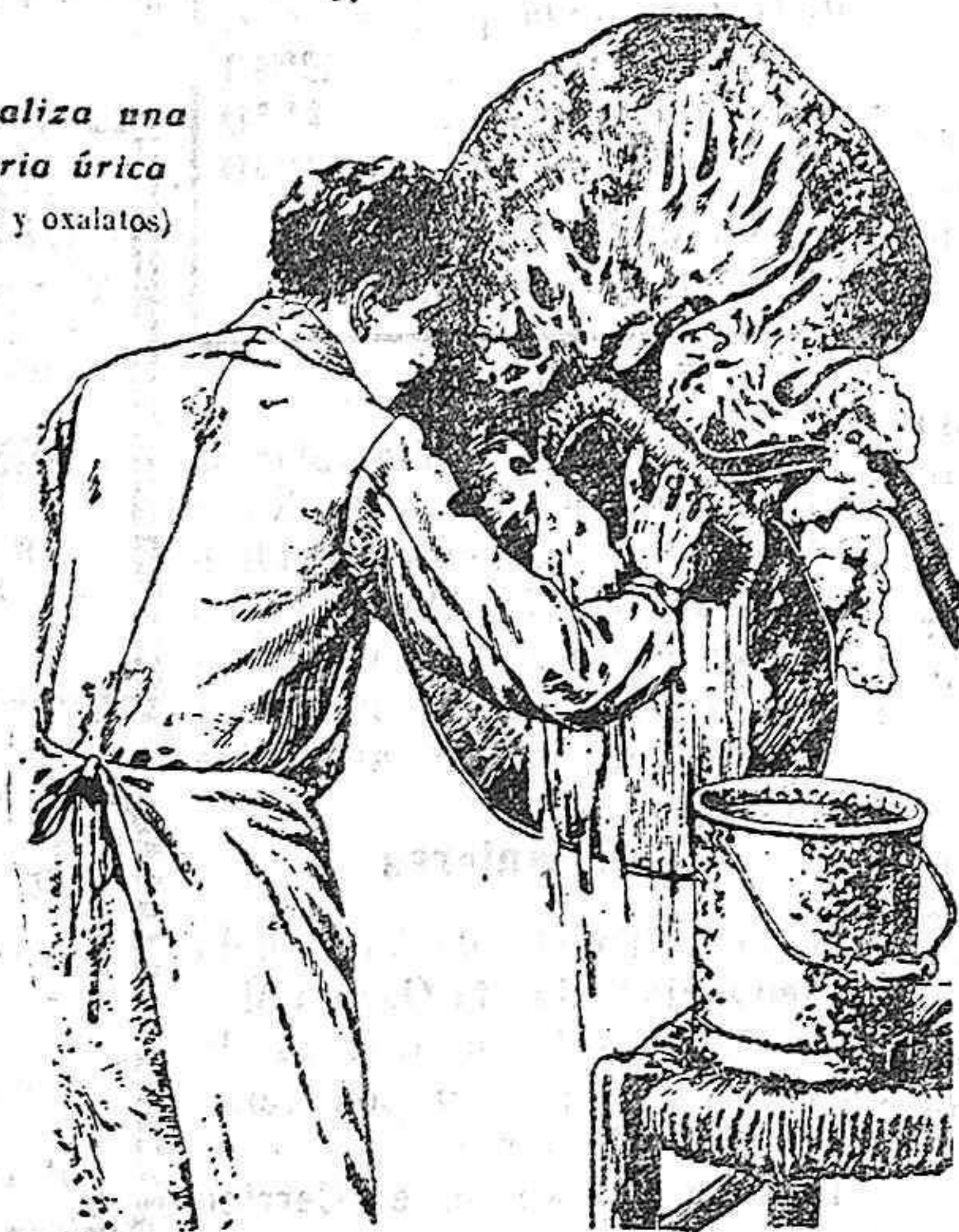
Exigir la marca depositada: EL HOMBRE DE LAS TENAZAS.