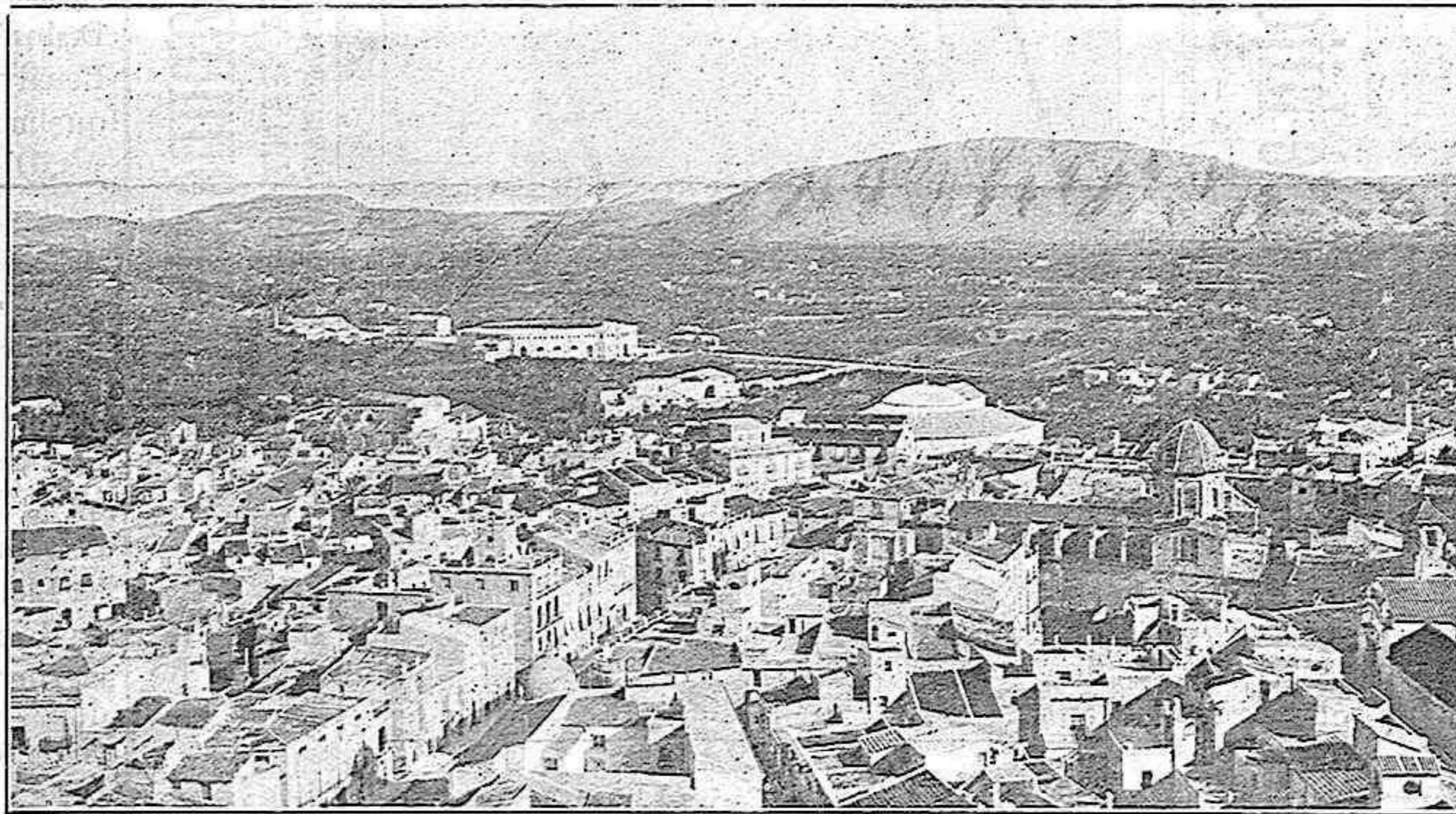
Vista parcial de la Ciudad de Orihuela.

medio de festejos, celebración de ferias y otros análogos, para dar solaz a sus moradores y atraer a su vez a sin número de forasteros, y esto se consigue, celebrando ferias anuales, en las que se exhiban diversidad de ar-