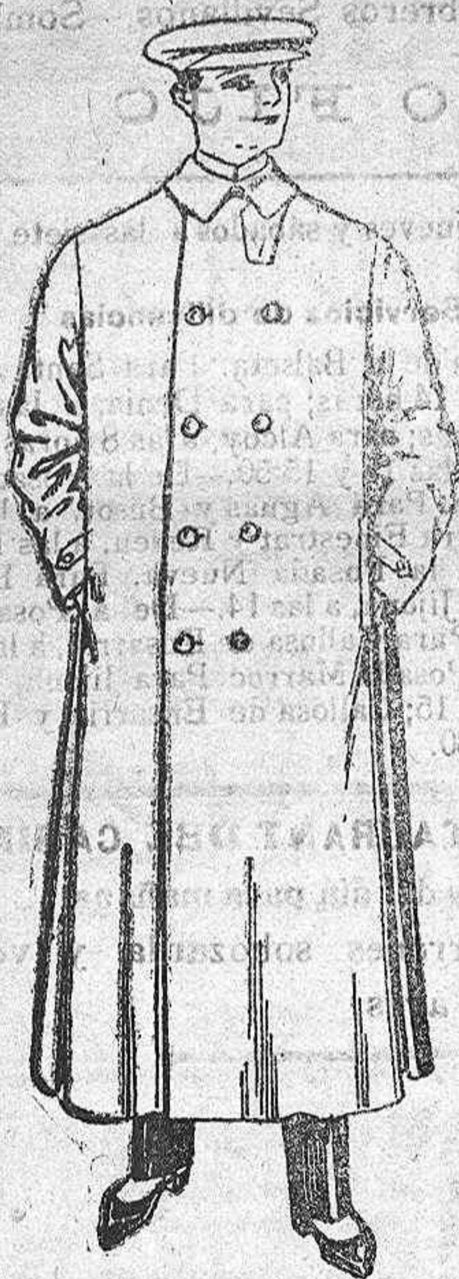
Guardapolvos de dril de Pesetas 8 á 25