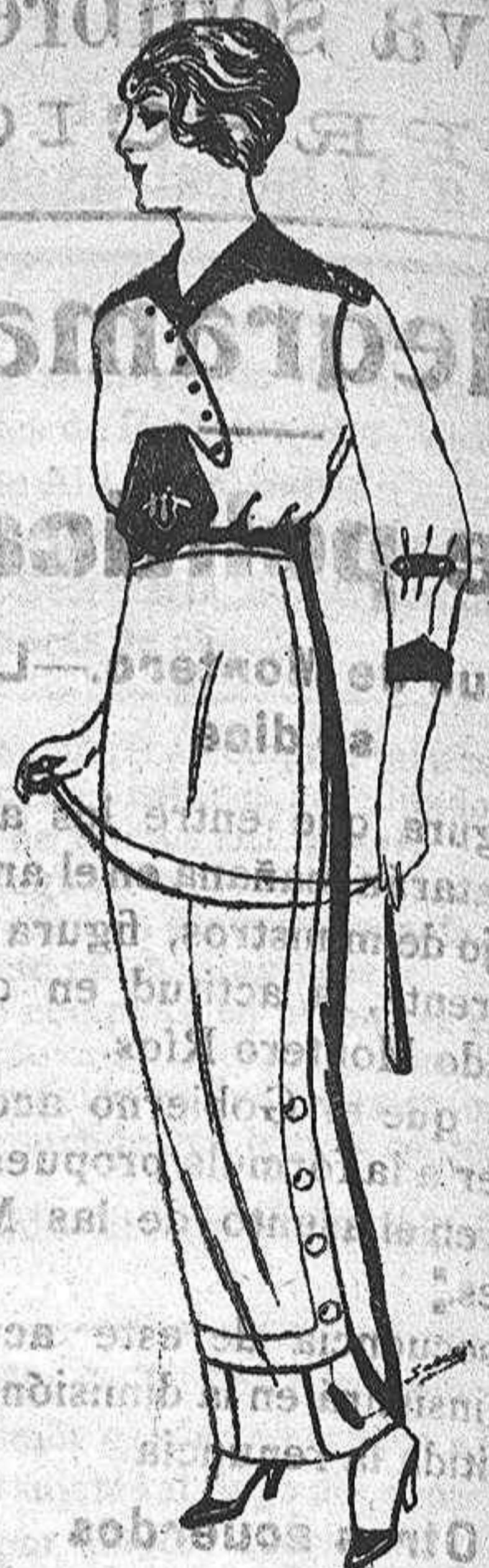
Blusa de seda blanca y colores, adornos borda- dos de Ptas. 25. Faldas de lana de ptas. 11 á 22

Agua Griega [Los calvos]—Los que han padecido enfermedades graves. Los que quieran conservar una cabellera larga, sedosa, exenta de imcreos y otros enemigos que amenacen su destrucción, deben usar AGUA GRIEGA, que es el mejor y más barato calvicida.—Precio del frasco, 2 pesetas