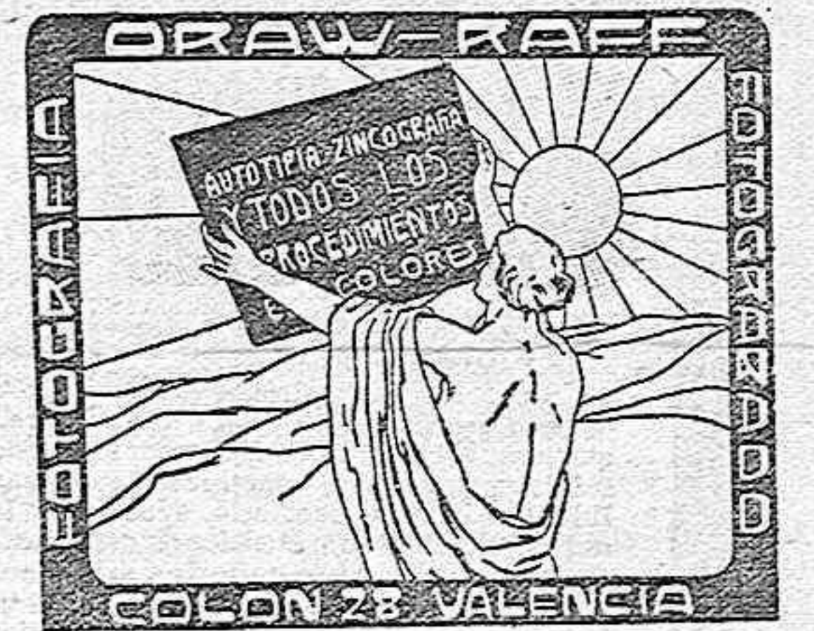
IMP. LIT. T. MUÑOZ