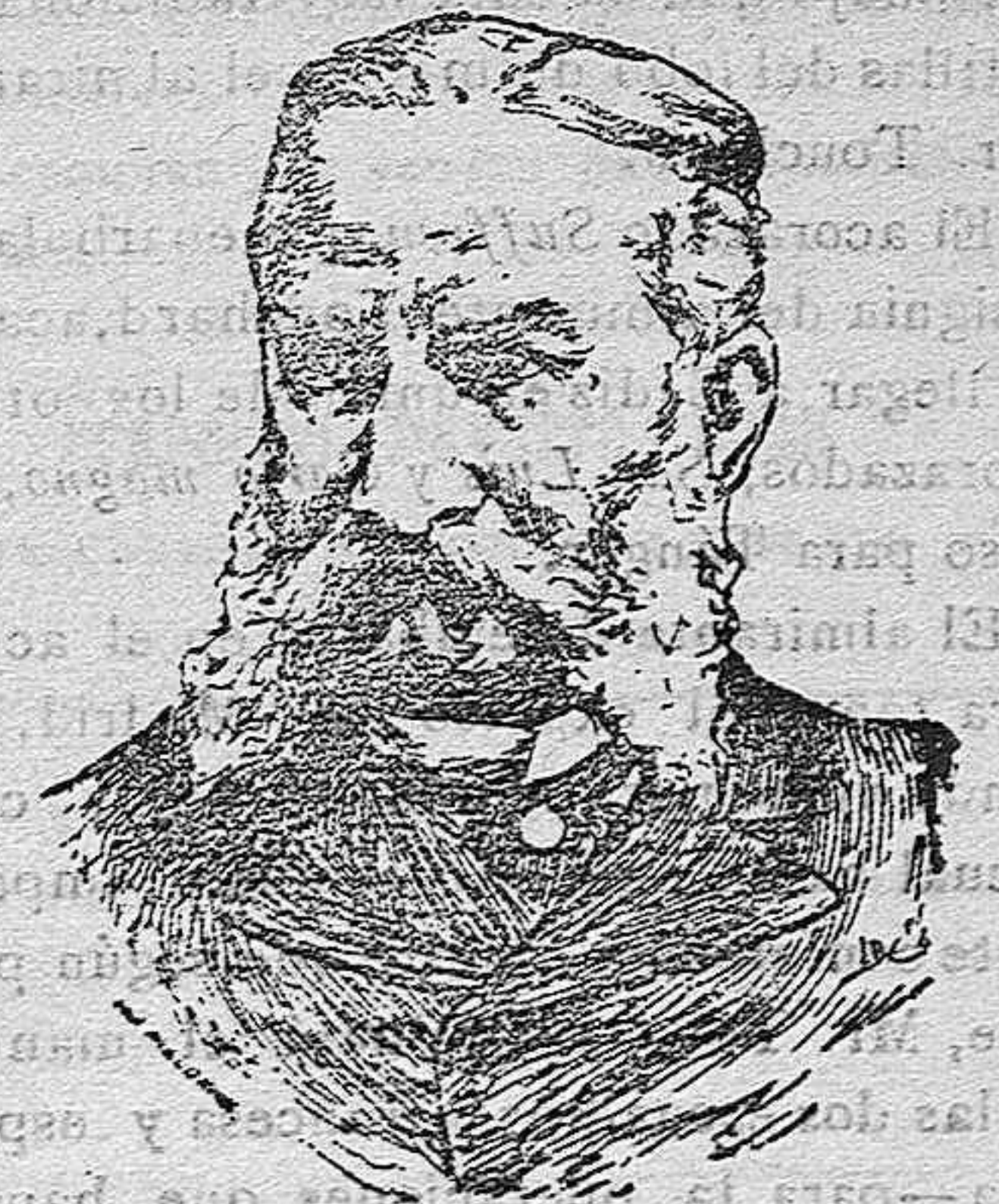
El viejo Marqués, duro, con osque-

Muerto el conde de Cheste ¿quién se atrevía á ponerse al lado del marqués de la Vega de Armijo, en punto á historia política y á servicios prestados siempre al partido liberal?