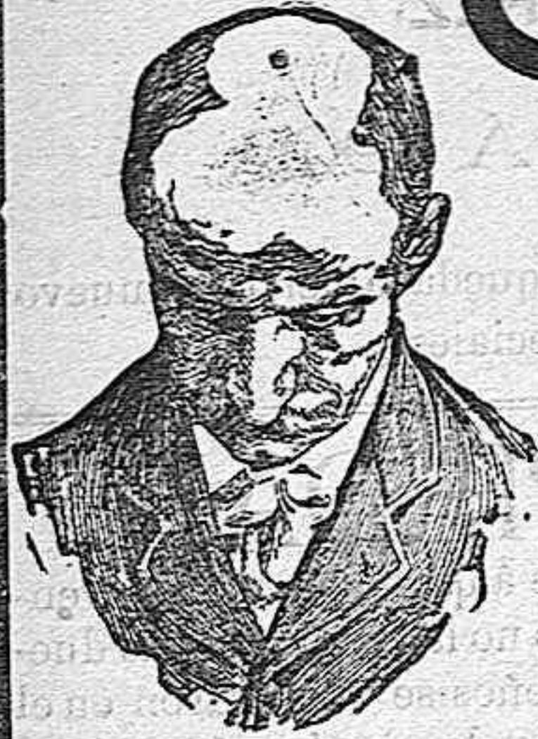
Antes de usar el Capilhol