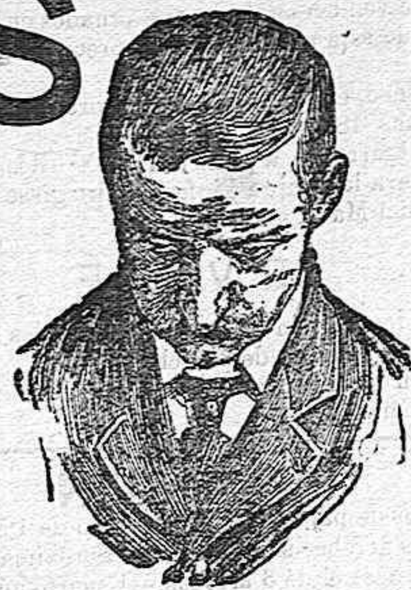
Después de usar el Capilhol

usando el Capilhol se obtiene la curación de toda clase de calvicies. Robustece el cabello y su raíz, limpia y perfuma la cabeza e impide la caída del cabello.