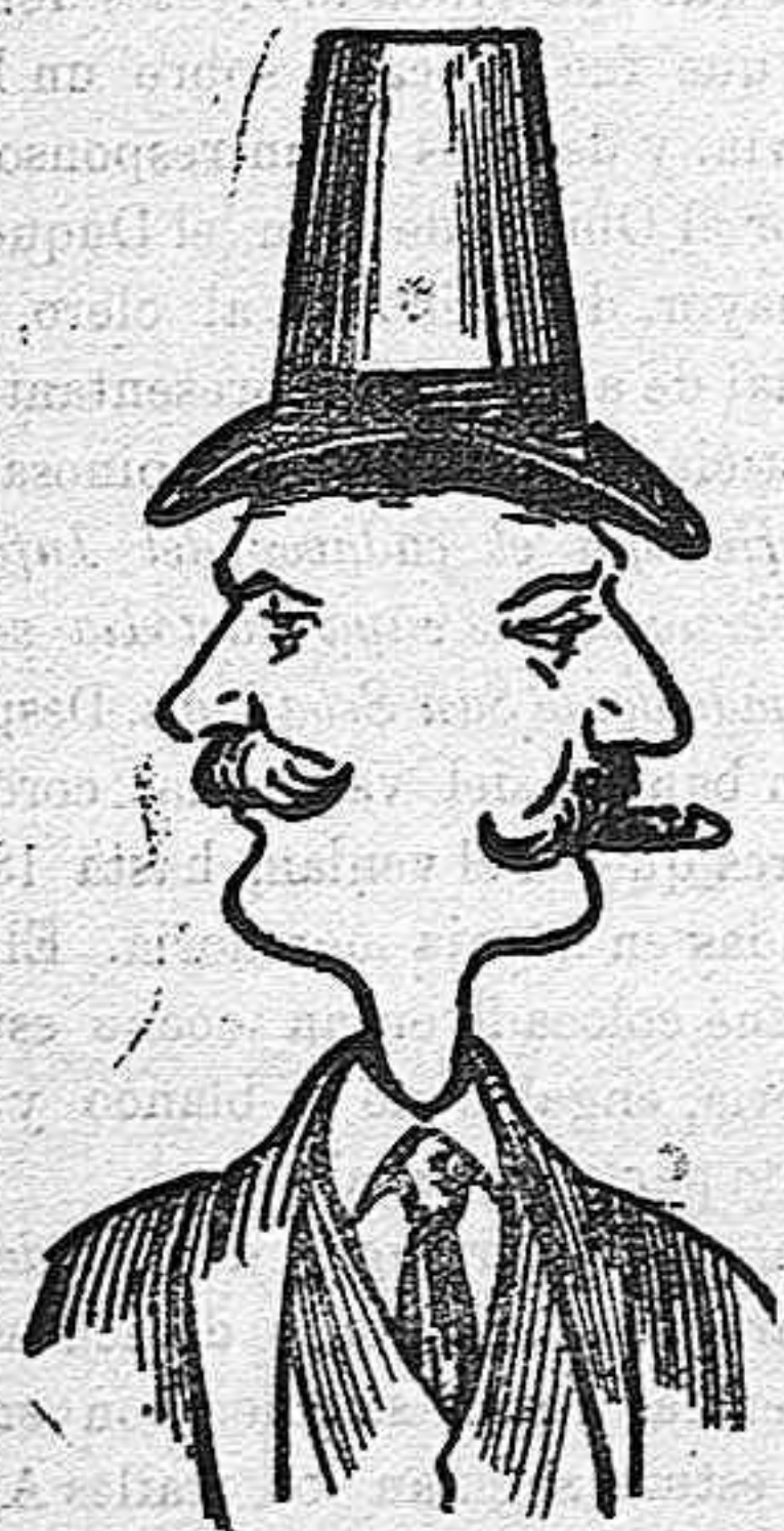
LA DOBLE FAZ.

No es nuestro dibujo, como a primera vista parece, la reproducción de ningún fenómeno; es tan sólo una muestra del adelanto a que ha llegado el arte de la fotografía.