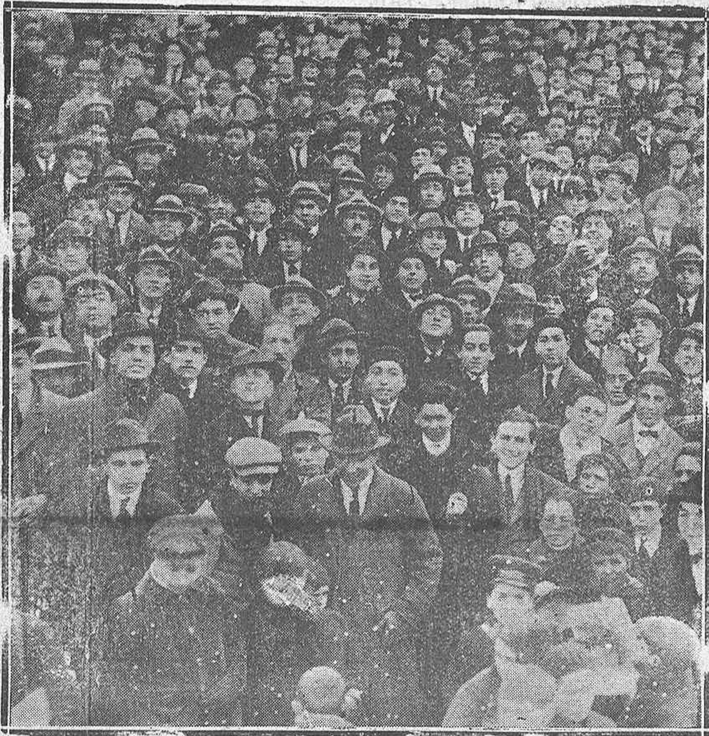
Madrid.—Grupo de manifestantes pidiendo la rebaja de los alquileres

Teléfono 80 : No se devuelven originales.