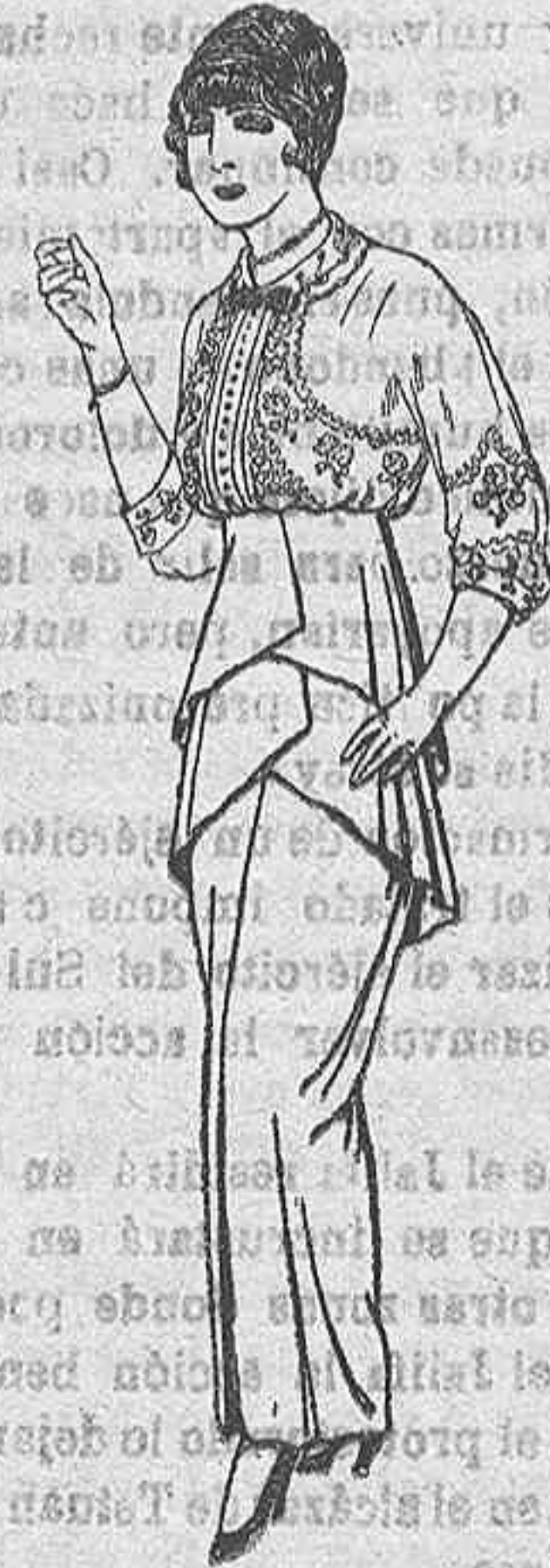
Blusas de seda blanca. De Pesetas 22 a 25. Faldas de lanilla igual al modelo. De Pesetas 15 a 22.

GORRAS, SOMBREROS DE PAJA, CINTURONES, CORBATAS, CALZETINES, FAJAS, LIGAS, TIRANTES, ETC., ETC.