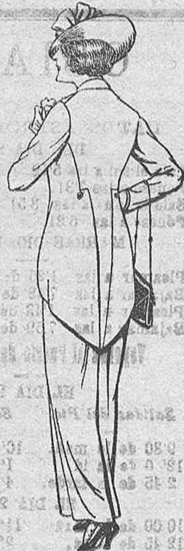
Traje de lanilla para Señora. A Pesetas 25.