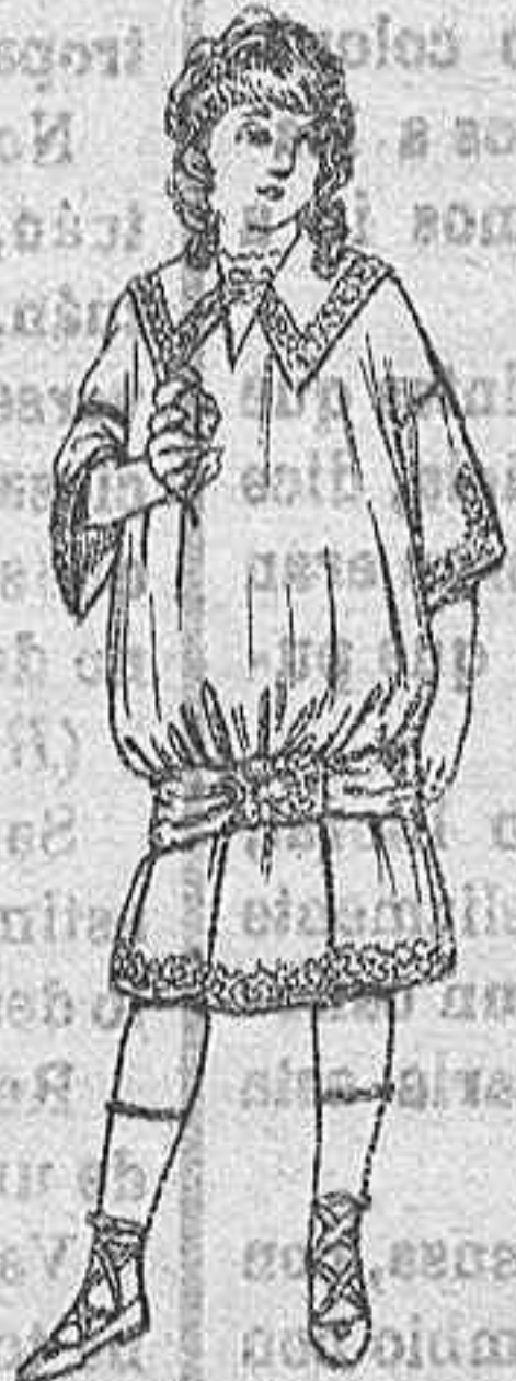
Vestidos de dril para niñas de 4 a 9 años. De Ptas. 10 a 12.