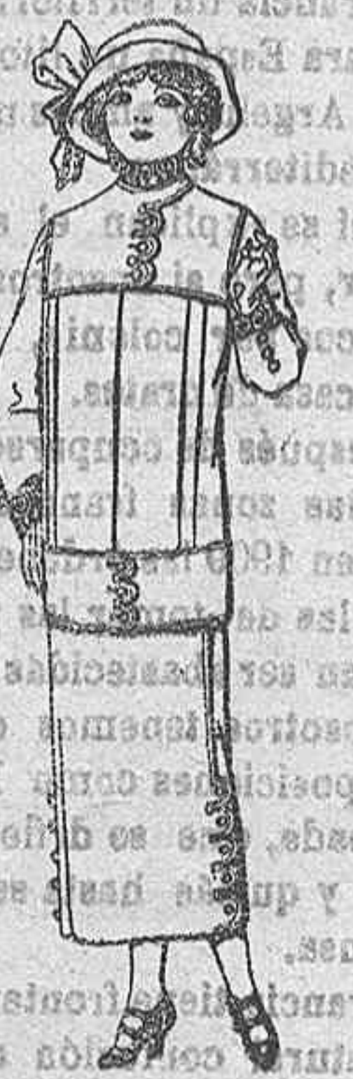
Trajes de lanilla para jovencitas de 13 a 16 años. A Pesetas 37.