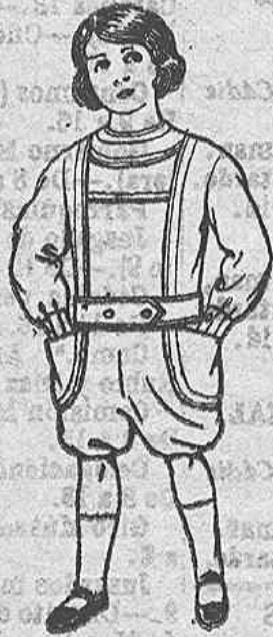
Trajes delantal de dril color beige y azul, para niños de 3 a 6 años. De Ptas. 6 a 12.