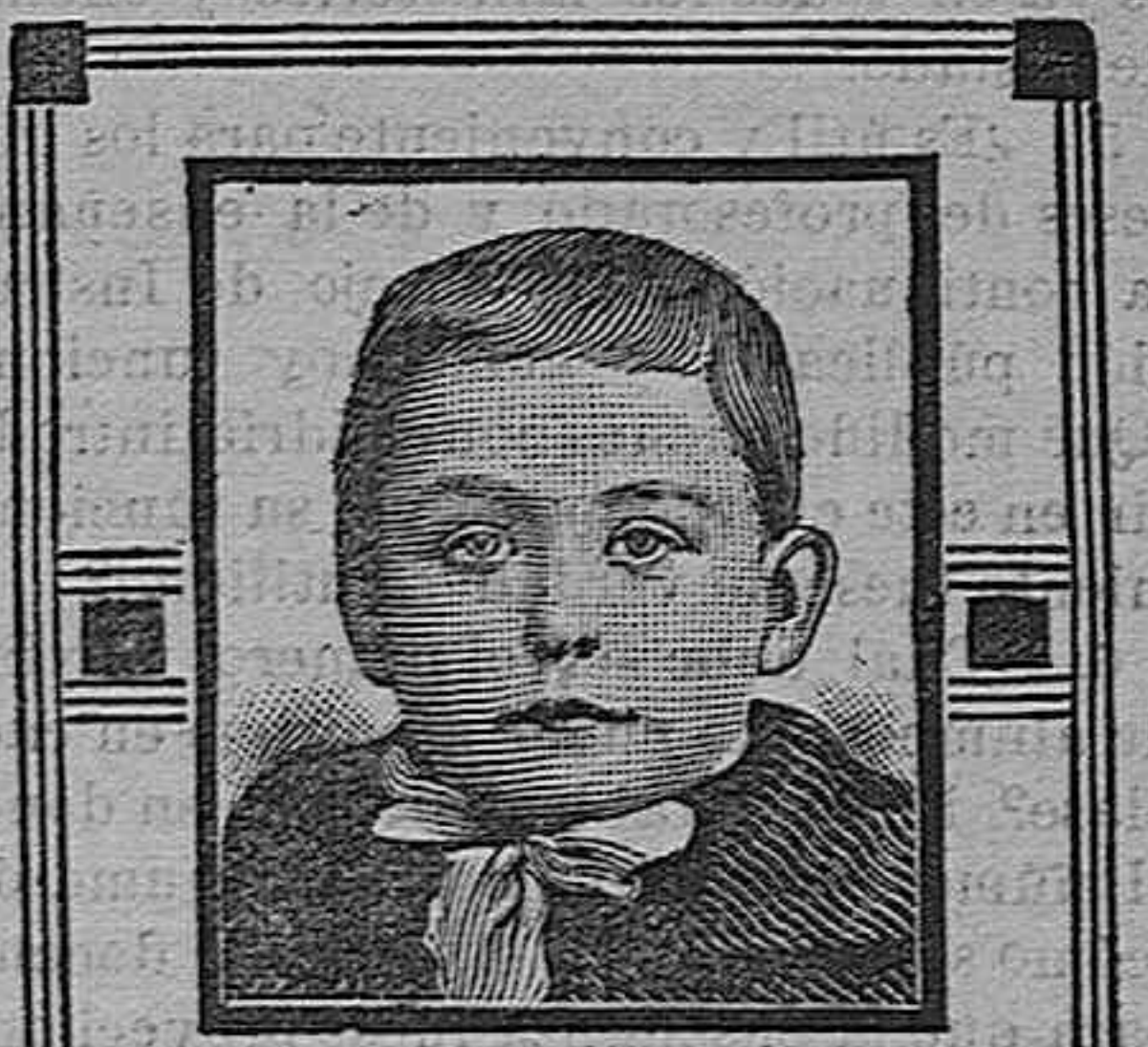
Mataró, 7 Marzo 1908.

Premio. —Por el Ministerio de Marina se conceden al Centro Obrero de San Fernando 50 pesetas, que deberán invertirse en un objeto de arte para premio del alumno que haya demostrado mayor aplicación y aprovechamiento durante el último curso.