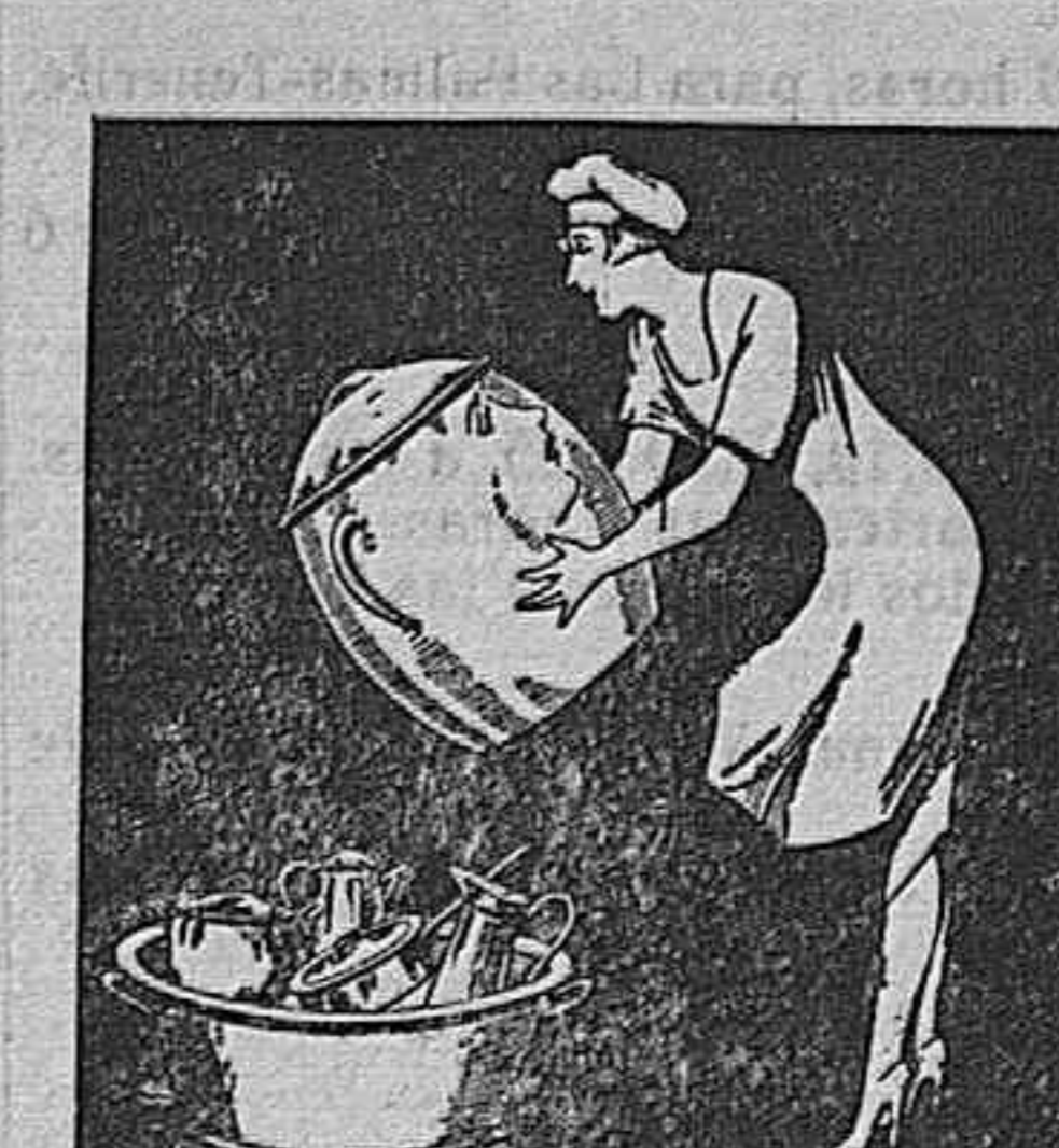
Pedid siempre la mejor batería de cocina MARRON-GRIS, marca TRES CHIMEEAS, ROJO-CORRAL y TERRACOTA marca KET-TV es la universalmente apreciada

Buen día de prueba ha sido para el celoso Juez Sr. Arias Vila, la jornada de hoy, que ha costado las dos primeras víctimas del año en esta capital