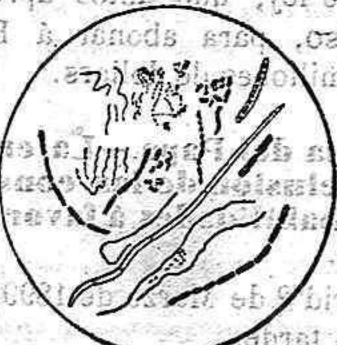
VARIAS FORMAS DE BACTERIAS DE LA BOCA.

en el anti-séptico dental «Odol», que imposibilita por completo el desarrollo de las caries. Por consiguiente, las personas que deseen conservar sanos sus dientes hasta la edad más avanzada, deberán acostumbrarse desde niños a lavarse cada día la boca con el «Odol». La manera de hacerlo es la siguiente: se toma un sorbo de agua odolizada y se lo guarda 2 ó 3 minutos en la boca para que el antiséptico del «Odol» pueda penetrar bien en todas partes; y después, con un segundo sorbo, se enjuaga con fuerza la boca y se hacen gárgaras: esto es lo que se llama odolizar. Las personas que con regularidad se odolizan la boca por la mañana, la tarde y la noche, preservan por completo sus dientes de la caries y se libran de todo mal olor de la boca. El «Odol» tiene un gusto delicioso y refrigera agradablemente la boca. Aconsejamos, pues, encarecidamente y con toda buena conciencia, a cuantos quieran conservar sus dientes, que se acostumbren a cuidarlos médicamente por medio del «Odol». Las personas que tienen algunos dientes, o muelas, picados, son las que muy especialmente sentirán la bienhechora influencia de estos lavados: en este caso la acción es rápida y maravillosa.