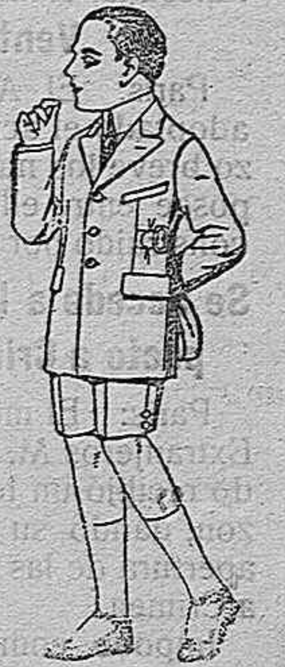
Trajes modelo Sport, de lanilla, estambre, melton, etc., para niños de 7 a 12 años. de ptas. 28 a 50.