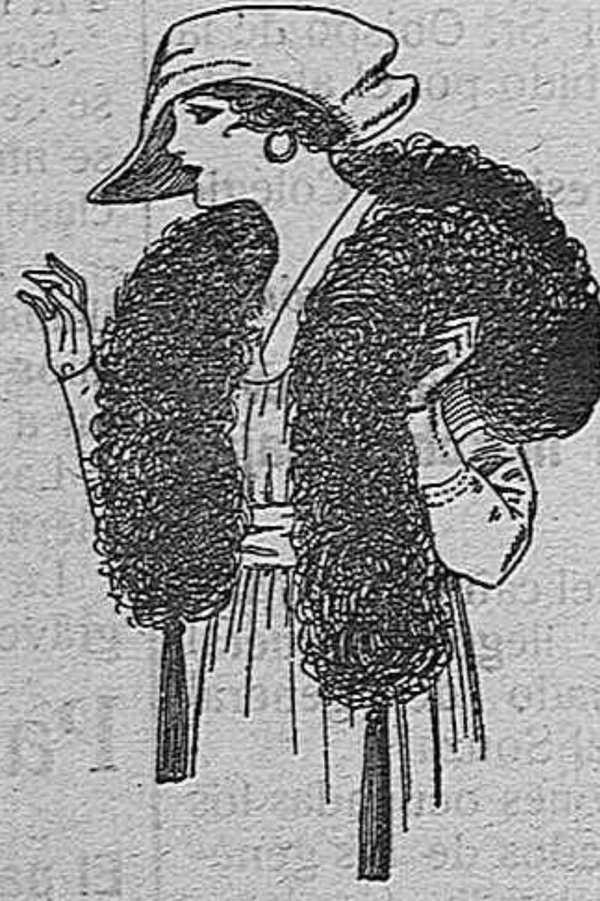
Boá de pluma de avetruz, en negro, blanco, café gris, etc. de ptas. 32 a 70