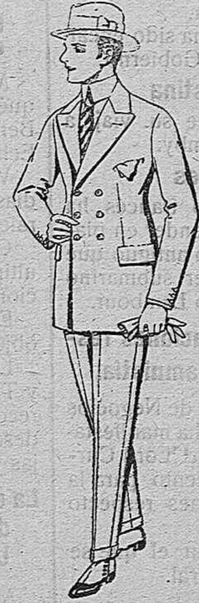
Trajes de lanilla, melton estambre, vicuña o jerga. de ptas 48 a 120