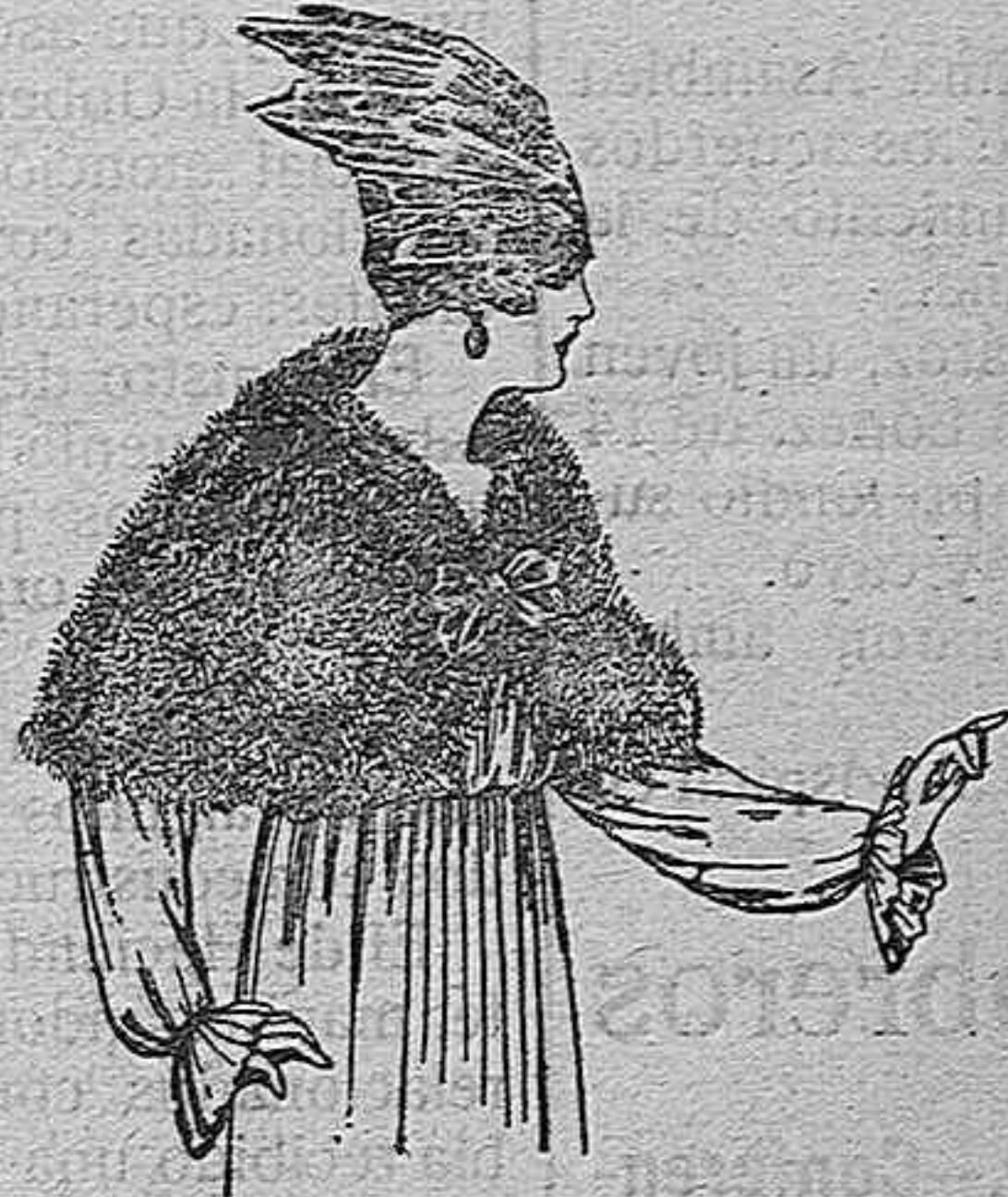
Capelinas de marabú adornadas, con cinta y forro de seda. de ptas. 32 a 50