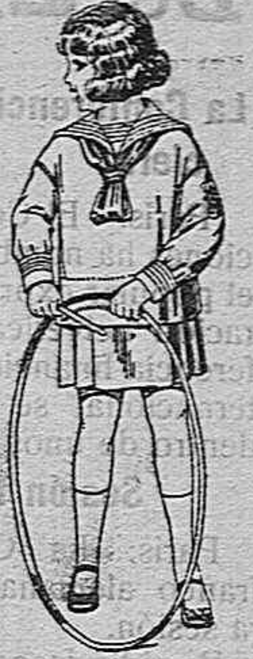
Trajes modelo «Marinera inglesa», de estambre o jerga azul, para niños de 4 a 9 años. de ptas. 30 a 54