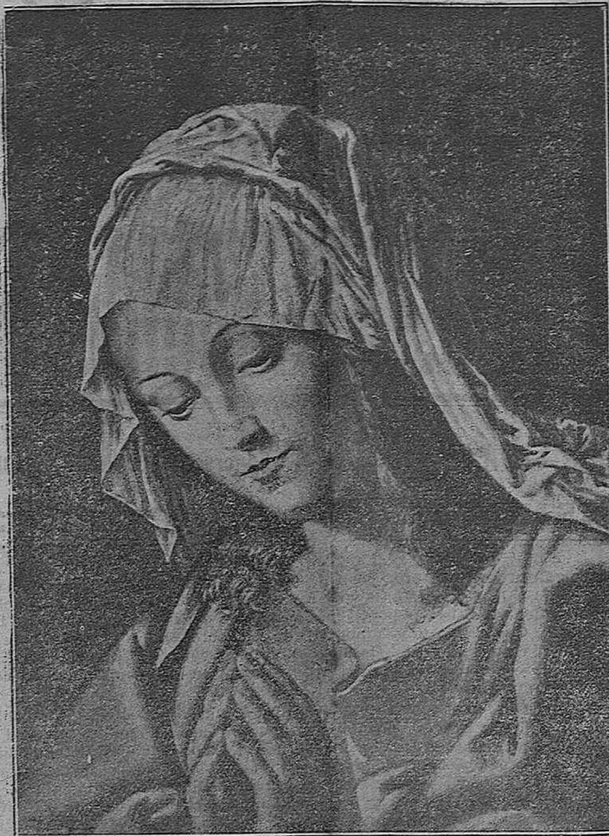
LA VIRGEN EN CONTEMPLACIÓN SASSOFERRATO (1605-1685)